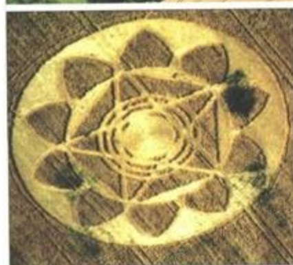
„Bythornský zázrak“, poslední a nejpůsobivější piktogram roku 1993