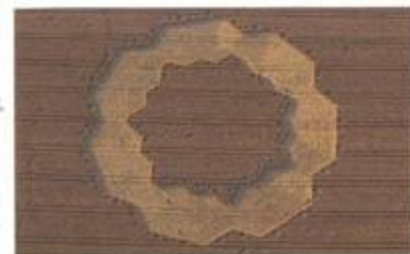
„Handkerchief with centre“ (Kapesník se středem). West Stowell, Wiltshire. 9. srpen 1998. Průměr cca 500 stop (152 m). Pšenice.