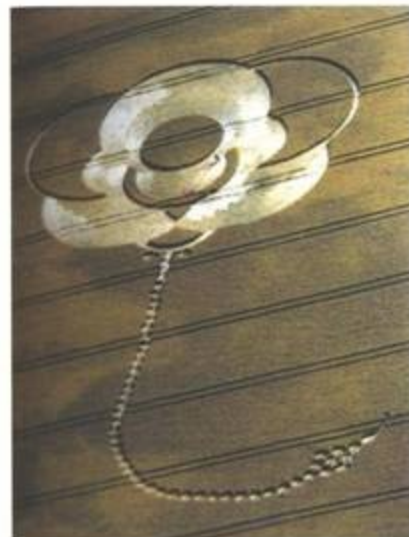
„Sting Ray“ (Rejnok). Beckhampton, Wiltshire. 21. červenec 1998. Délka cca 450 stop (136 m). Pšenice.