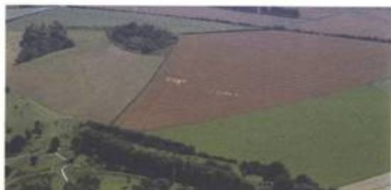
Tři formace. Danebury Hill, Hampshire. 2. srpen 1998.