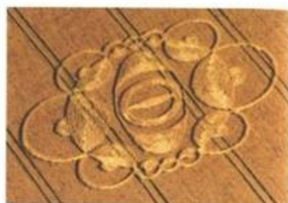
„Broach 2“ (Brož 2). Windmill Hill, Butser, Hampshire. 10. červenec 1998. Průměr cca 200 stop (61 m). Složitá čtyřúhelníková formace. Ječmen.