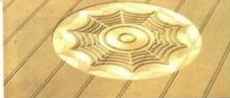
Poslední piktogram roku 1994: obrovská pavučina, jež se objevila 15. srpna těsně vedle pravěkého kamenného kruhu v Avebury