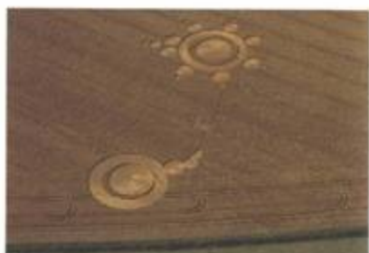
„Thought Bubble and Broach“ (Myšlenková bublina a brož). Danebury, Hampshire. 2. srpen 1998. Průměr cca 60 stop (18 m). Pšenice.