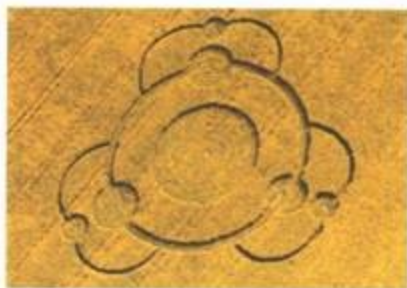
„Trefoil“ (Trojlístek). Goodworth Clatford, Hampshire. 10. květen 1998. Prstenec o průměru asi 148 stop (42 m) s třemi kruhy překrývajícími prstenec v úhlu cca 120°. Kolem kruhů jsou tři vnější srdcovité polokruhy. Řepka.