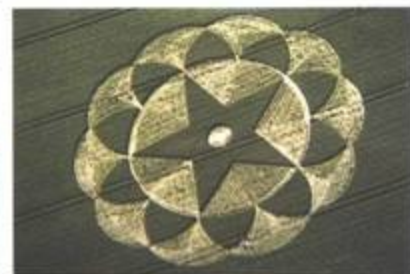
„Mandala“. Avebury Trusloe, Wiltshire. 20. červen 1998. Průměr cca 200 stop (61 m). Pšenice.