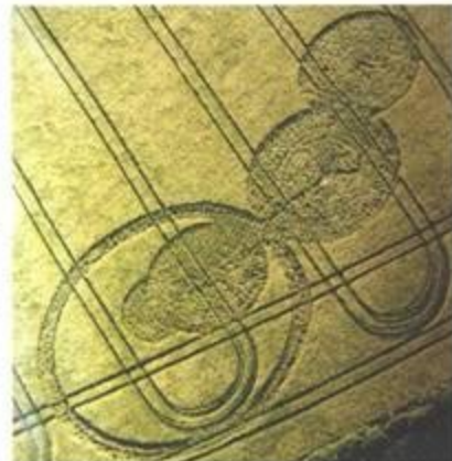
„Thought Bubbles“ (Myšlenkové bubliny). Newton St Loe, Avon. 17. květen 1998. Délka cca 300 stop (91 m). Ječmen.