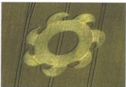
„Seven-side Circular Saw“ (Sedmizubá kotoučová pila). Danebury Hill, Hampshire. 8. červenec 1998. Průměr cca 130 stop (39 m). Pšenice.