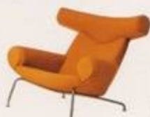
Hans J. Wegner 1961