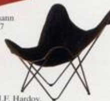
J.F. Hardoy, A. Bonet & J. Kurchen 1938