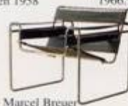
Marcel Breuer 1925