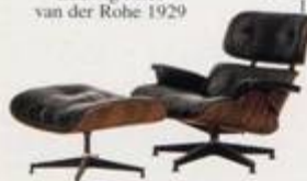
Charles Eames 1956