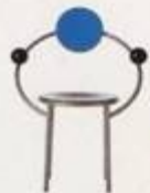
Michele De Lucchi 1983