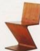
Gerrit Rietvelt 1934