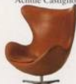
Arne Jacobsen 1958