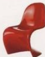
Verner Panton 1960