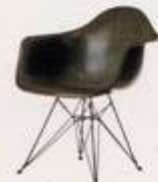
Charles Eames 1949