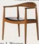
Hans J. Wegner 1949