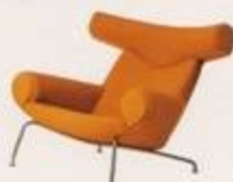
Hans J. Wegner 1961