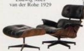
Charles Eames 1956