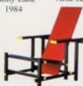
Gerrit Rietvelt 1917, 1918