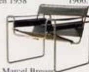
Marcel Breuer 1925