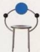
Michele De Lucchi 1983