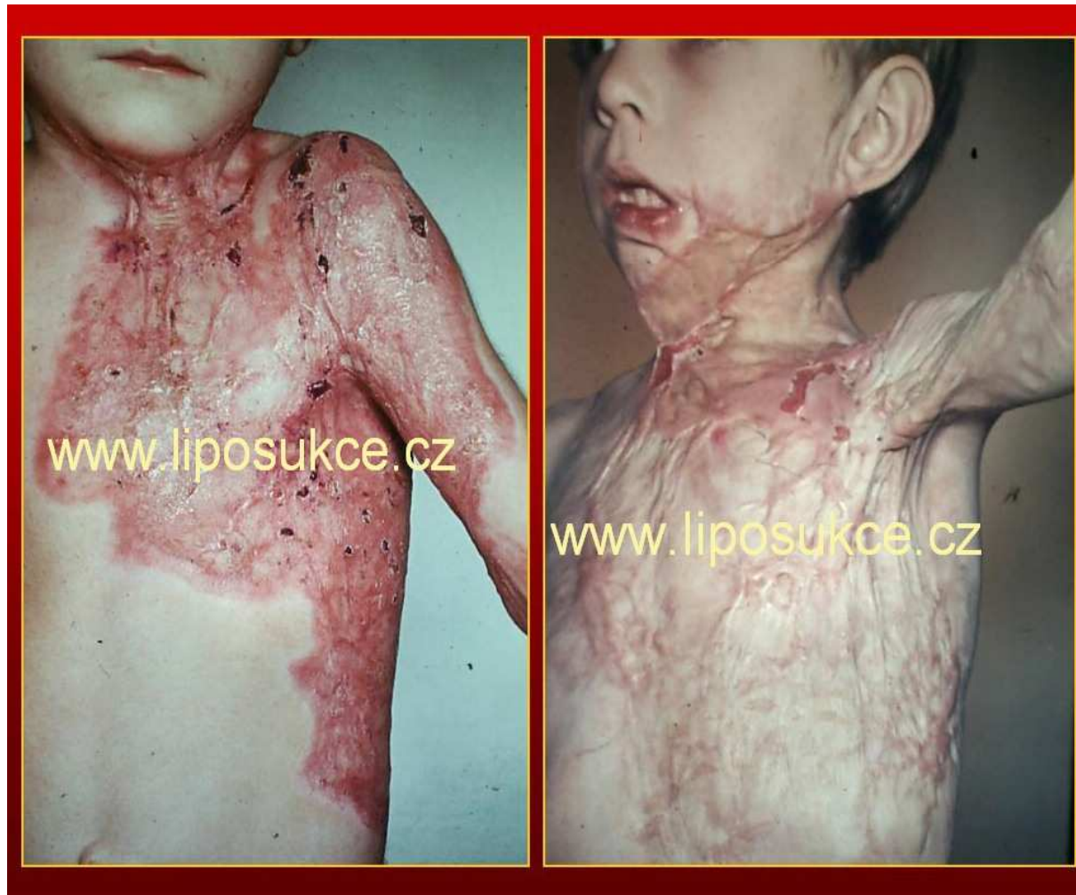
Foto: 1/3 Rozsáhlá popálenina