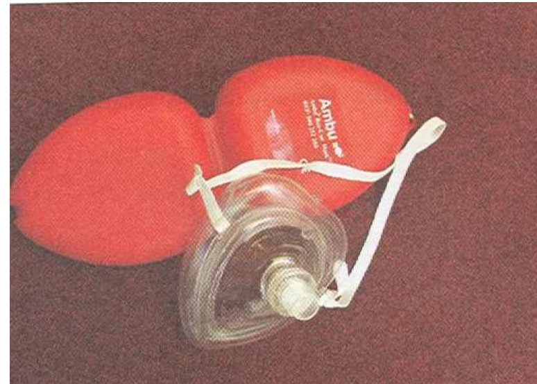
FOTO 1/ osobní ochranné pomůcky