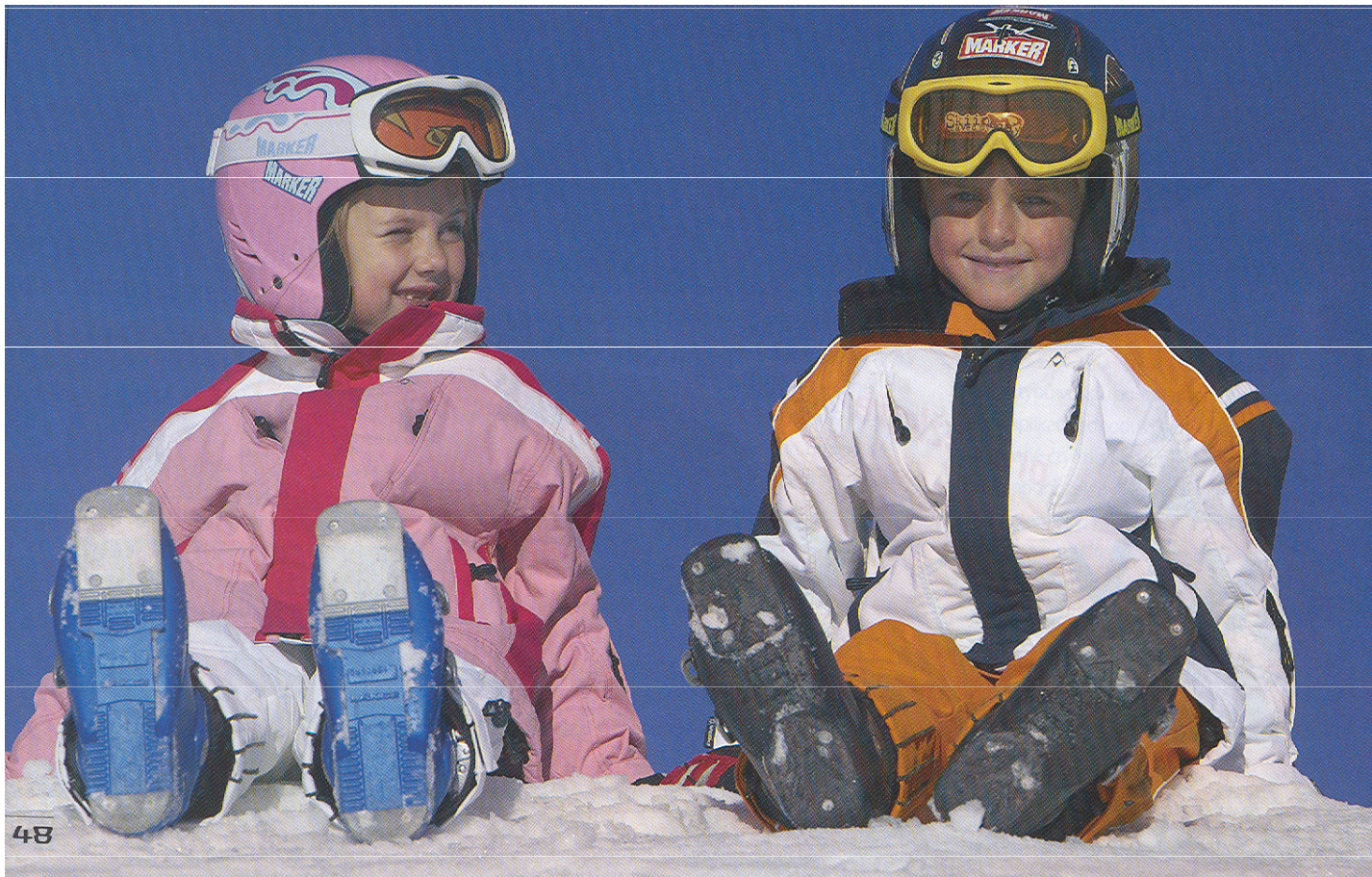
Foto 1/2 Dítě s lyžařskou přilbou