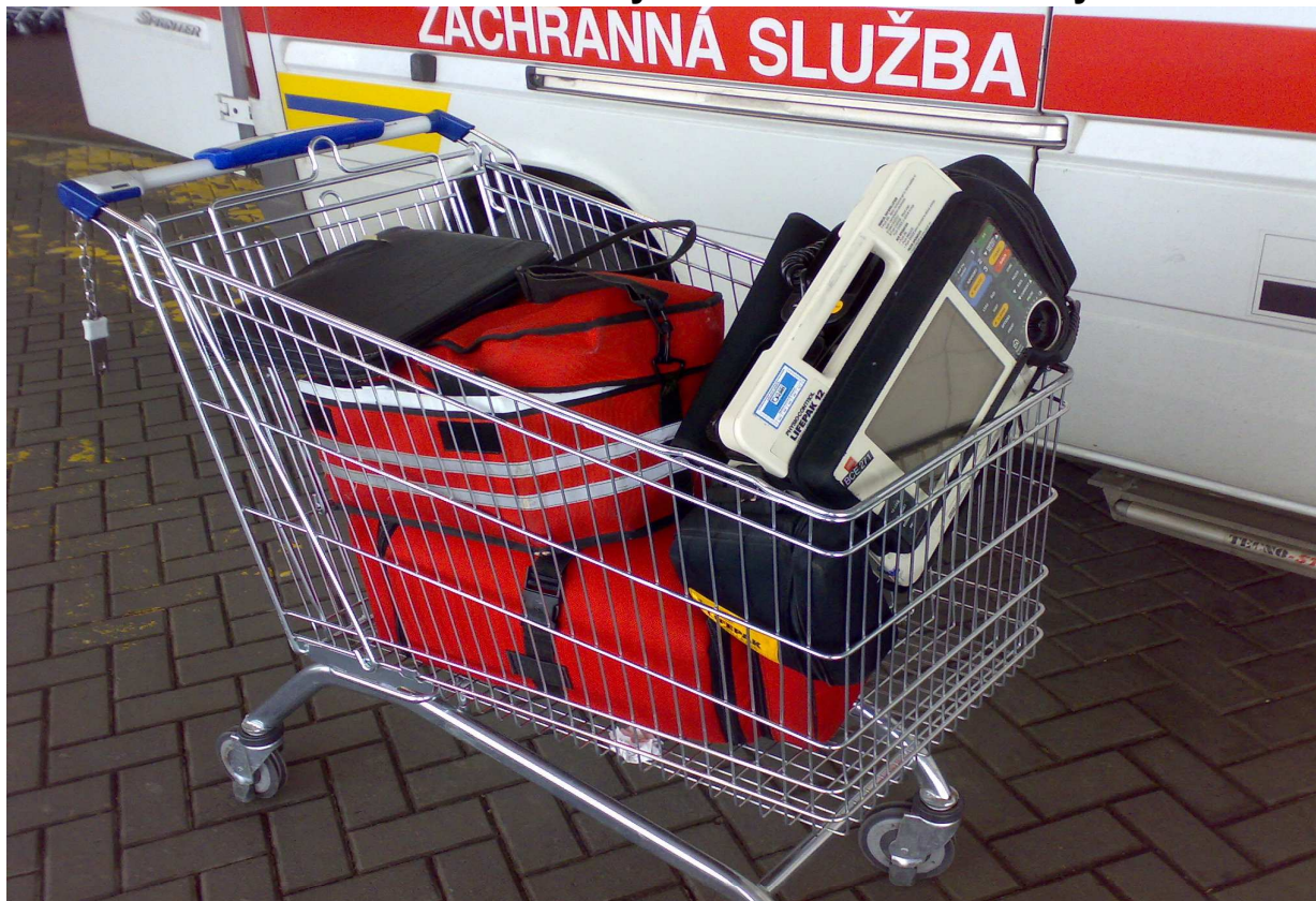
FOTO : vybavení záchranné služby netradičně