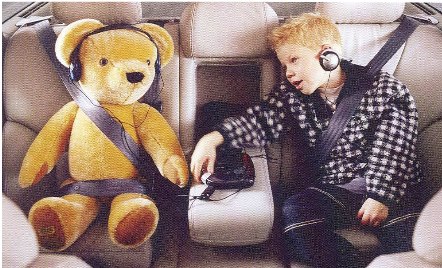
Foto:1/1 Bezpečí pro dítě , www.climex dětem.cz