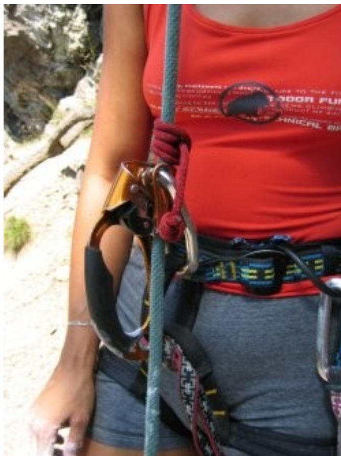
Zálohování Tibloku při těžce činnosti.