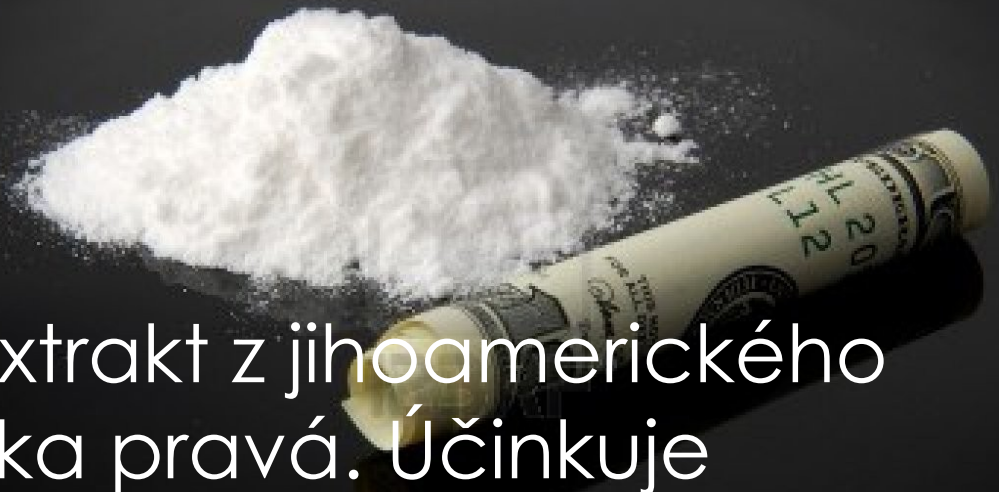
Erythroxylum coca Erythroxylaceae George K. Linney