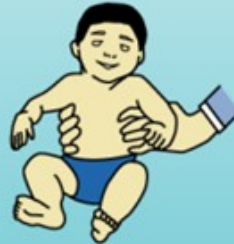
Sits with support