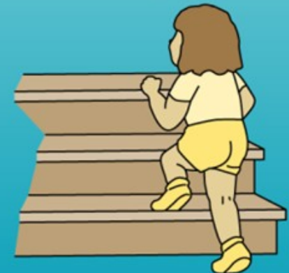
Walks up steps