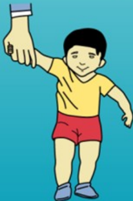
Walks holding on