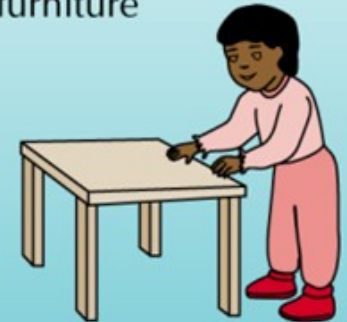
Stands holding furniture