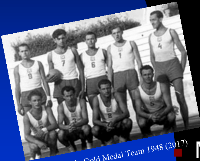
Czechoslovakia Gold Medal Team 1948 (2017)