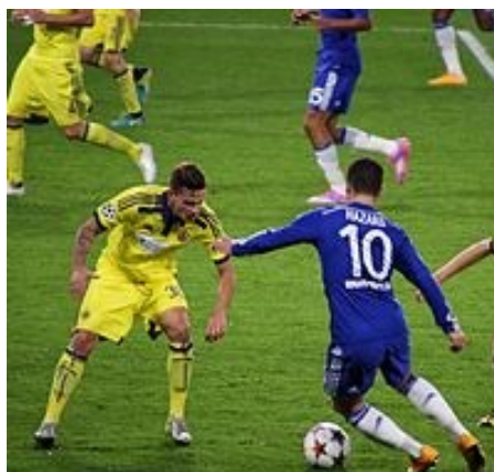
Obrázek 4 https://upload.wikimedia.org/wikipedia/commons/thumb/9/90/Chelsea_6_Maribor_0_Champions_League_%2815599549805%29.jpg/200px-Chelsea_6_Maribor_0_Champions_League_%2815599549805%29.jpg