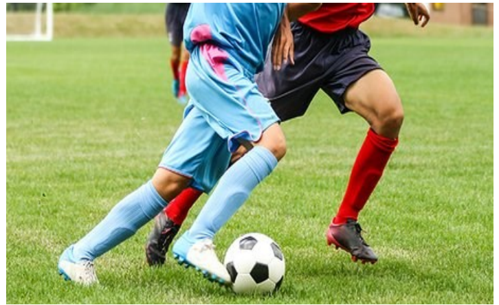
Obrázek 5 http://www.minutefacile.com/wp-content/uploads/2018/05/01CC010407448093-c1-photo-phpltdqem.jpg