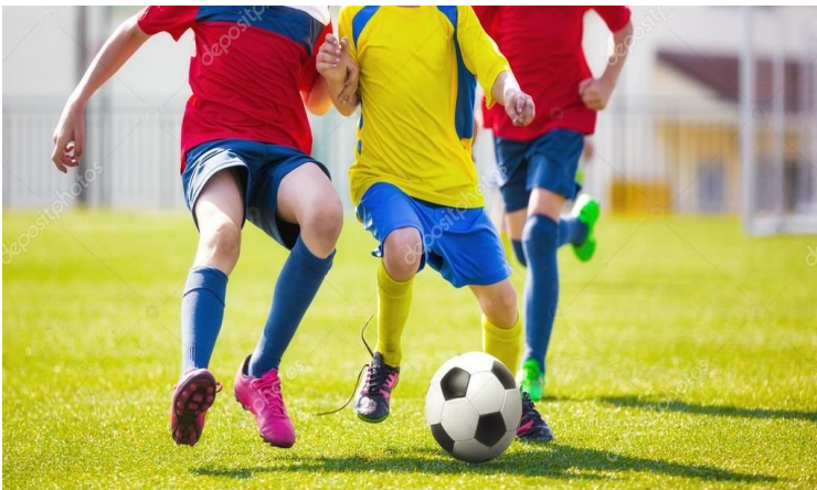
Obrázek 6 https://st3.depositphotos.com/4318427/12663/i/950/depositphotos_126631202-stock-photo-children-play-football-soccer-football.jpg