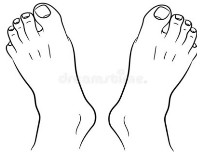
Obrázek 3 https://thumbs.dreamstime.com/b/feet-men-top-view-contour-black-lines-white-illustration-feet-men-top-view-contour-black-lines-white-102321268.jpg