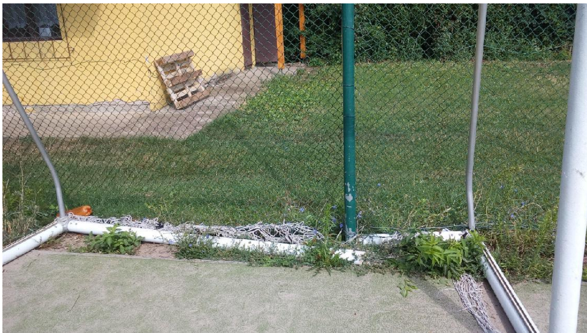
Obr. 15 Nepřípevněná, rozbitá fotbalová branka