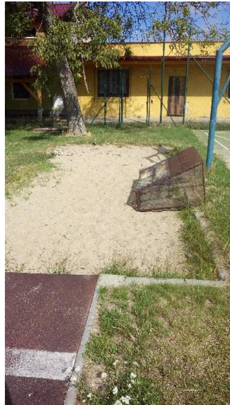
Obr.7 Branka umístěna v doskočišti