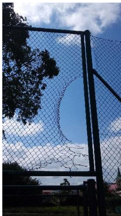
Obr. 13 Poškozený plot