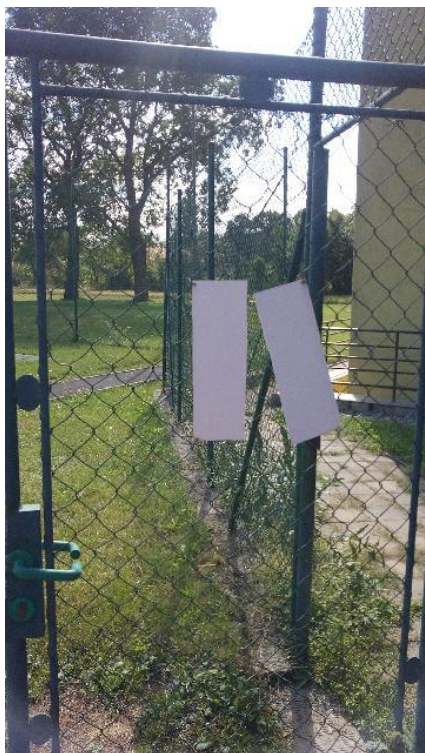
Obr. 12 Provozní řád