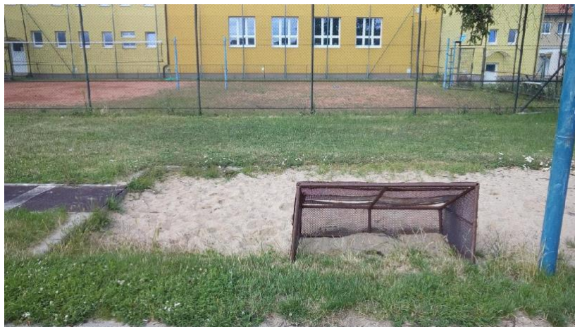
Obr. 8 Branka umístěna v doskočišti