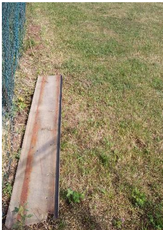
Obr. 9 Okap položený u stupní brány