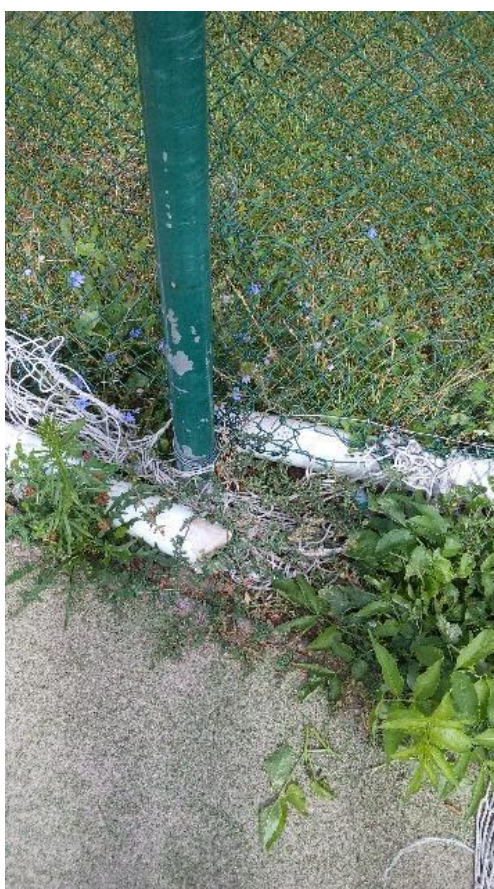
Obr. 16 Detail poškození branky