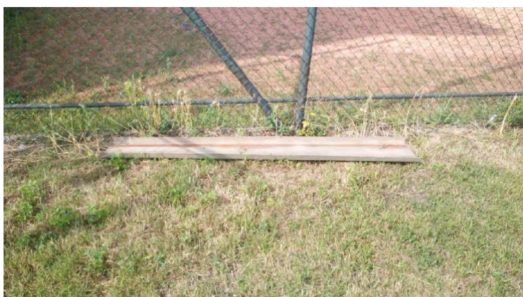
Obr. 10 Okap položený u vstupní brány