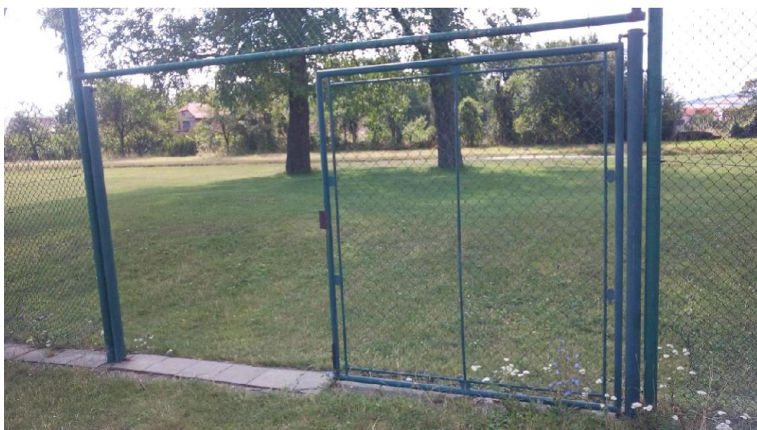
Obr. 14 Chybějící část brány