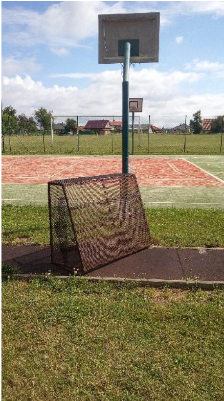
Obr. 6 Branka umístěna v rozběžišti