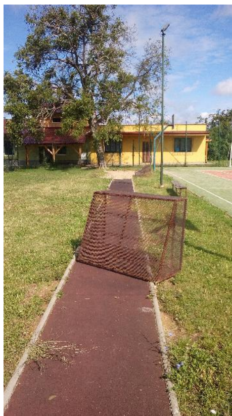
Obr. 5 Branka v rozběžišti