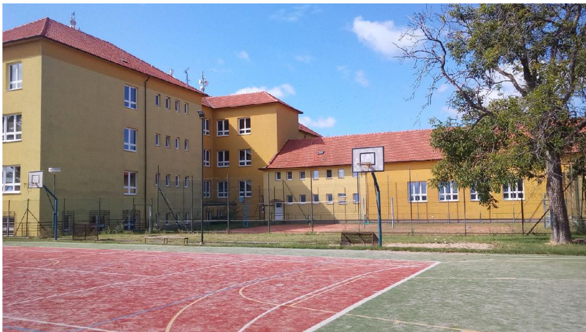
Obr. 17 Hřiště u Základní školy a mateřské školy v Hroznové Lhotě