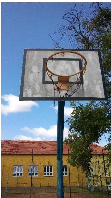
Obr. 4 Chybějící síť v koši