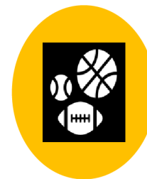
NEZISKOVÉ EVROPSKÉ SPORTOVNÍ AKCE (SNCESE)