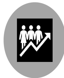
PARTNERSTVÍ MALÉHO ROZSAHU (SSCP)