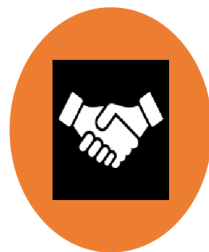
KOOPERATIVNÍ PARTNERSTVÍ (SCP)