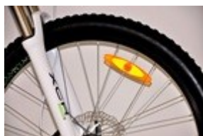
Obr. 4: Odrázky na kole

Odrázkami musí být povinně jízdní kolo vybaveno vždy, i když není viditelnost snížena. Odrázový materiál na oděvu a botách může odrázky v určitých případech nahrazovat.