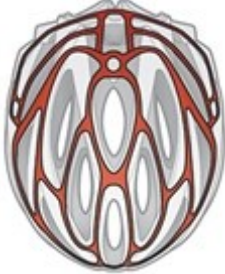
Obr. 8: Vnitřní výztuha