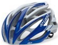
Obr. 9: silniční přilba