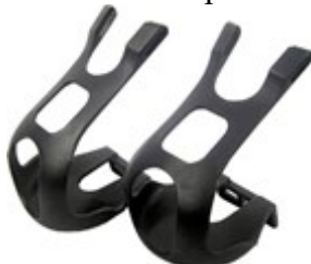
Obr. 22: Klipsny