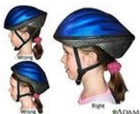
Obr. 15: Správné a nesprávné nasazení přilby