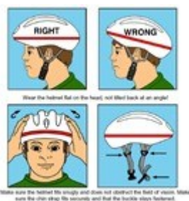
Obr. 14: Správné nasazení přilby