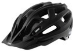
Obr. 10: MTB přilba