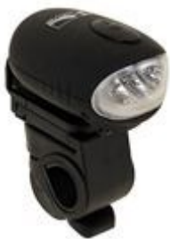
Obr. 5: Halogenové světlo