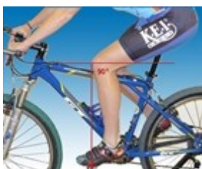
Obr. 3: Nastavení předozadní polohy sedla

Poměry délek trupu a končetin určují polohu sedla a řídítek ( Obr. 3). Při správném nastavení je výška sedla taková, aby jezdec dosáhl patou chodidla na pedál nacházející se v nejnižší poloze s nohou mírně pokrčenou a dokázal bez vychýlení boků několikrát protočit pedály vzad (Obr. 9, 10). Sklon sedla by měl být minimální (sedlo je rovnoběžné s podstavou), pokud směřuje špičkou příliš k zemi, jsou namáhané paže, v opačném případě dochází k bolestem v bederní části zad. Každá sedlovka má naznačenou minimální hranici zasunutí do rámu, kterou je z bezpečnostních důvodů třeba respektovat.