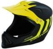
Obr. 11: DH, BMX přilba