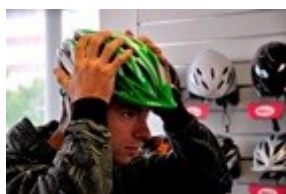
Obr. 12: Správné nasazení přilby