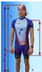
Obr. 2: Tělesné míry ovlivňující seřízení správného posedu

Poměry délek trupu a končetin určují polohu sedla a řídítek ( Obr. 3). Při správném nastavení je výška sedla taková, aby jezdec dosáhl patou chodidla na pedál nacházející se v nejnižší poloze s nohou mírně pokrčenou a dokázal bez vychýlení boků několikrát protočit pedály vzad (Obr. 9, 10). Sklon sedla by měl být minimální (sedlo je rovnoběžné s podstavou), pokud směřuje špičkou příliš k zemi, jsou namáhané paže, v opačném případě dochází k bolestem v bederní části zad. Každá sedlovka má naznačenou minimální hranici zasunutí do rámu, kterou je z bezpečnostních důvodů třeba respektovat.