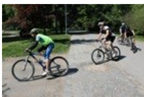
Obr. 18: Reflexní vesta

Oděv je z hlediska bezpečnosti provozování cykloturistiky důležitý ze dvou důvodů. Prvním z nich je ochrana zdraví při zabezpečení maximálního tepelného komfortu těla jezdce a druhým důvodem je viditelnost jezdce při pohybu za snížené viditelnosti nebo za tmy na komunikaci či v terénu (viz Obr. 18).