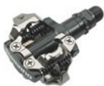
Obr. 21: SPD pedál

Vhodnost užití speciální cyklistické obuvi je především v tuhosti podrážky a využití nášlapného systému, který fixuje polohu chodidla na pedálu i při zdolávání terénních nerovností. Turistické tretry mají podrážku s jemnějším vzorkem z měkčené pryže s otvorem pro montáž zářezky zakrytým odstranitelným dílem, tretry tak lze částečně využít při turistické chůzi.