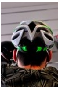
Obr. 6: Systém upínání

Další odlišnosti nalezneme u upínacího systému. ( Obr. 6) Ten má za úkol přilbu bezpečně zajistit nalavě. Výrobci nejčastěji používají otočné kolečko nebo jezdec pohybující se po plastovém ozubeném pásku. Funkčně jsou obě technologie rovnocenné. Ojediněle se lze setkat i s jinými systémy.