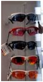
Obr. 17: Cyklistické brýle

Konstrukce brýlí je často řešena tak, aby zabránila stékání potu z čela do očí.