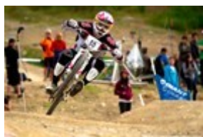
Obr. 20: Chrániče holení

Kromě přilby slouží k ochraně zdraví při pádu také chrániče loktů, holení a kolen. Výběrem správného oděvu, který je z odolných materiálů lze eliminovat masivní zranění povrchu těla při pádu (viz Obr. 20).