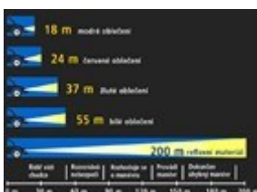
Obr. 19: Rozdíly ve viditelnosti různých materiálů z pohledu řidiče

Viditelnost lze zefektivnit vhodnou barvou oblečení a doplňky z fluorescenčních a reflexních materiálů, které zvyšují světelný kontrast vůči pozadí, a prodlužují tak vzdálenost, na jakou může řidič chodce nebo cyklistu zaznamenat (viz Obr. 19).