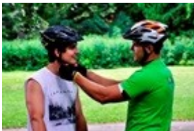
Obr. 16: Kontrola přilby před vyjížděnkou

Vyučující, kteří organizují cyklistické kurzy, by proto měli dbát zvýšené pozornosti, co se týče stavu, funkčnosti, nastavení i výběru vhodné přilby u žáků ( viz obr. 16).