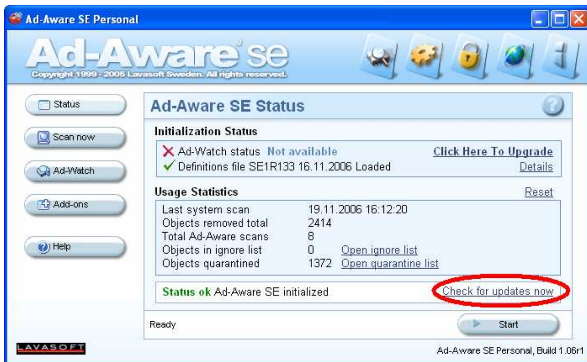
Obr. 1 – aktualizace