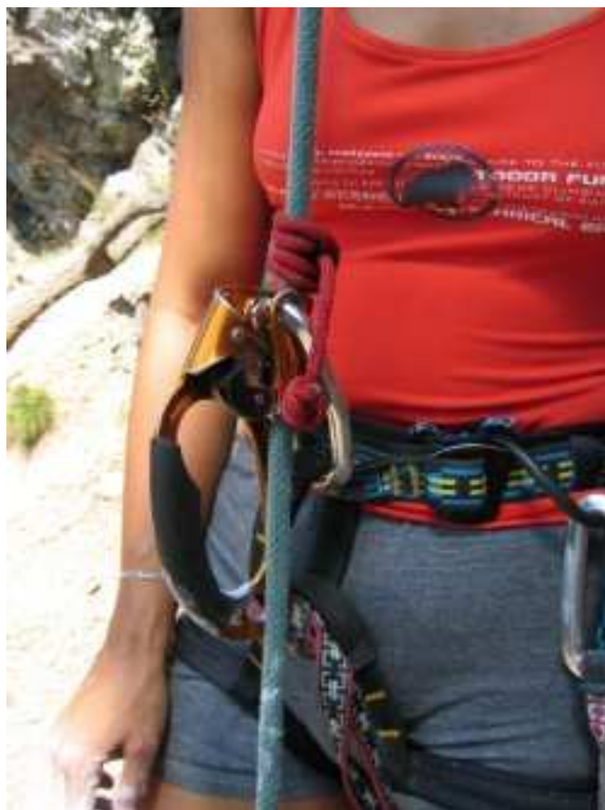
Zálohování Tibloku při těžce činnosti.