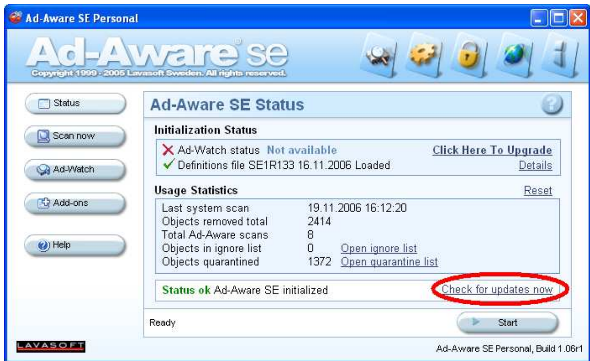
Obr. 1 – aktualizace