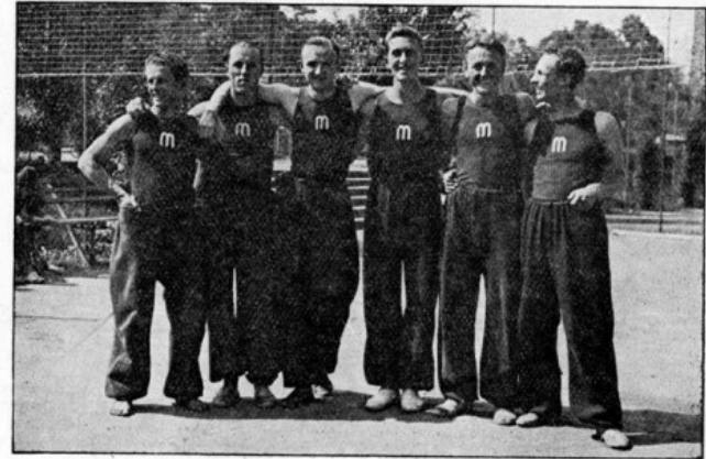
Obr. 130. I. volejbalové družstvo Masarykovy koleje z r. 1933. Masaryková kolej staví každoročně několik prvotřídních družstev a drží i mistrovství kolejí.