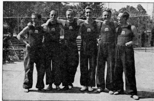
Obr. 130. I. volejbalové družstvo Masarykovy koleje z r. 1933. Masaryková kolej staví každoročně několik prvotřídních družstev a drží i mistrovství kolejí.