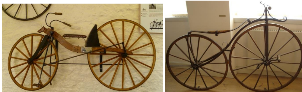
obr. 1a5- Replika vynálezu Maxmilana Kircpatrica, Drumlanring, Skotsko (zdroj: 1a-13)

Kirkpatrick Macmillan, vytvořil nový model stroje, který již fungoval bez kontaktu chodidel jezdce a terénu (viz obr. 1a5). Se svým šlapacím strojem, který byl opatřen řídky, urazil v roce 1842 během dvou dní trasu dlouhou 68 mil (zdroj: 1a-7). Svůj vynález nenechal nikdy patentovat, přestože kopie jeho stroje byla produkována Davinem Galzellem a více než 50 let byl považován za vynálezce tohoto stroje, spokojil se Macmillan se skromným životem na venkově. (zdroj: 1a-7).