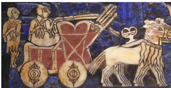
obr. 1a1 – Sumerský vůz

Počátek vzniku této disciplíny je třeba hledat u vůbec prvního známého použití kola. Vůz pro zemědělství nebo boj, který byl opatřen dvěma, resp. čtyřmi koly, je jako nejstarší znám u Sumerů 2500let př.n.l. ( viz obr. 1a1 ), podobný vůz používali i Egypťané.