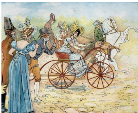
obr. 1a3 – Tricyclé á leviers manuels (zdroj: 1a-23, autor Maurice Neumont, foto: J.G. Berizzi)

Komentář [SH9]: http://www.karl-drais.de/en_biography.pdf