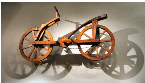
obr. 1a2 – Skica jízdního kola údajně od Leonarda da Vinci (zdroj 1a-10)

vývoj jízdního kola, základní cyklistické závody a osobnosti historie cyklistiky