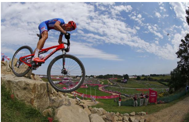
obr. 1a11 – OH 2012 – Jaroslav Kulhavý

Cyklistika se stala součástí každodenního dopravního systému, především díky nízkým provozním nákladům, významnou a dnes již tradiční součástí sportovních klání a volnočasovou aktivitou (zdroj: 1a-3)