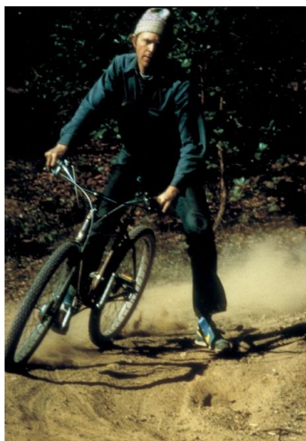
obr. 1a9 – Gary Fisher ve sjezdu

vývoj jízdního kola, základní cyklistické závody a osobnosti historie cyklistiky