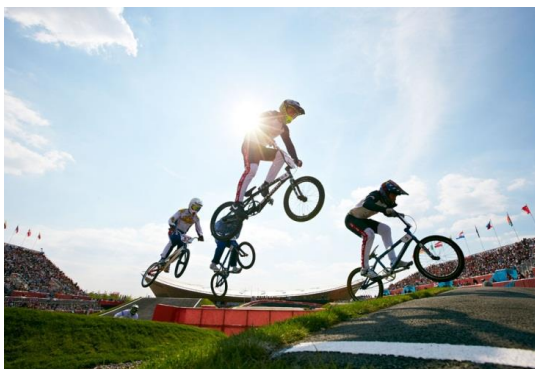
obr. 1a10 – OH 2012 – Třetí rozjížd'ka čtvrtfinále mužů (zdroj: 1a-34, autor John Huet)

Cyklistika stála na pokraji zrodu novodobých olympijských her. Silniční cyklistika se stala součástí programu od prvopočátku (silniční a dráhová cyklistika), později v Atlantě roku 1996 (zdroj: 1a-32) k ní byla zařazena i dráhová a horská cyklistika. Prozatím jako poslední z disciplín cyklistiky byl do olympijského programu zařazen bikros (BMX, viz obr. 1a10) v Pekingu 2008 (zdroj: 1a-33).