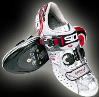
ERGO 1 CARBON DINO SIGNORE LIMITED EDITION