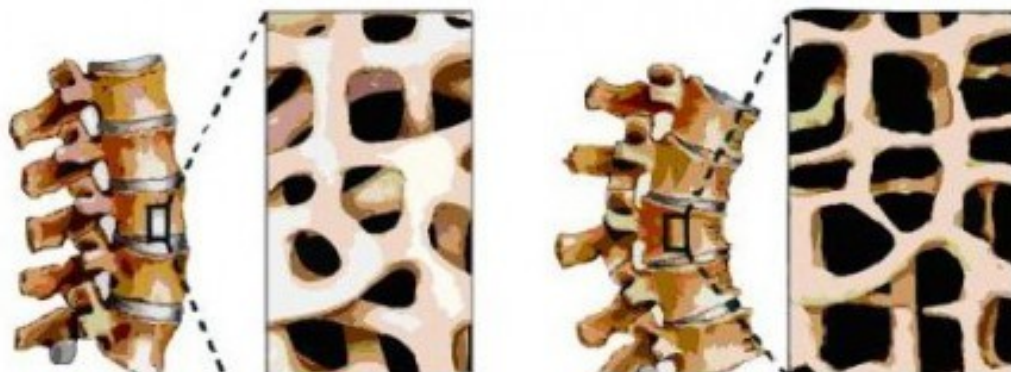
Obrázek č. 1: Osteoporóza 50