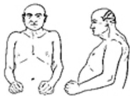
Typ pykniczny (pyknik)