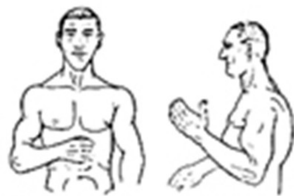
Typ atletyczny (atletyk)