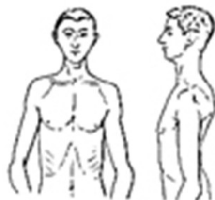
Typ asteniczny (leptosomatyk, astenik)