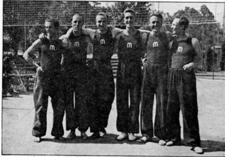
Obr. 130. I. volleyballové družstvo Masarykovy koleje z r. 1933. Masarykova kolej stavi každoročně několik prvotřídních družstev a drží i mistrovství kolejí.