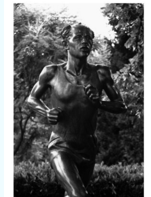
Schuster Eli - Emil Zátopek, Mesto Olympique Lausanne, 2007

Slouží pouze pro interní potřeby předmětu.