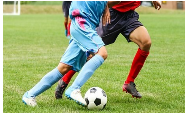
Obrázek 5 http://www.minutefacile.com/wp-content/uploads/2018/05/01CC010407448093-c1-photo-phpltdqem.jpg