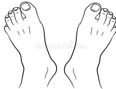
Obrázek 3