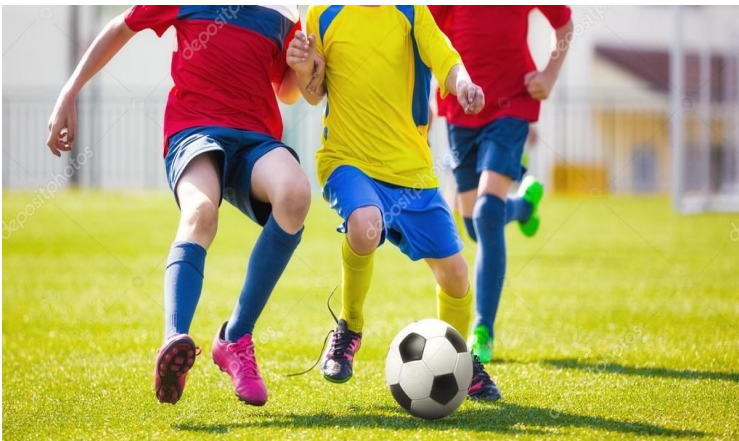
Obrázek 6 https://st3.depositphotos.com/4318427/12663/i/950/depositphotos_126631202-stock-photo-children-play-football-soccer-football.jpg