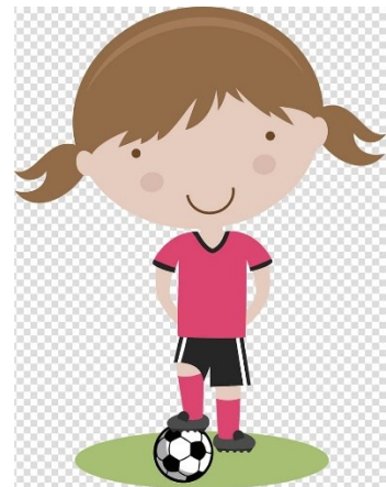
Obrázek 2 https://i7.pngguru.com/preview/825/91/662/baseball-woman-softball-clip-art-soccer-player.jpg