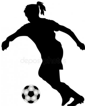
Obrázek 1 https://static6.depositphotos.com/1003857/605/v/450/depositphotos_6057004-stock-illustration-female-soccer-player.jpg

2) Na kterém obrázku je způsob vedení míče rychlejší? Proč?