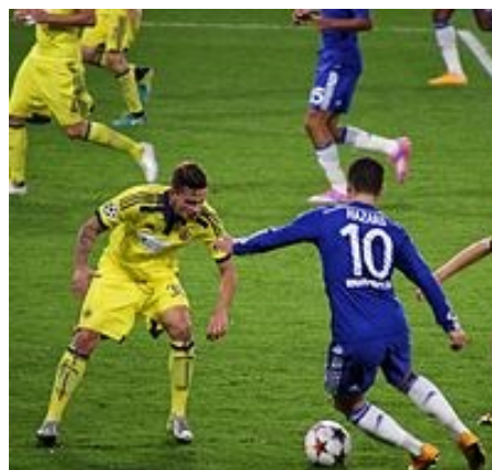
Obrázek 4 https://upload.wikimedia.org/wikipedia/commons/thumb/9/90/Chelsea_6_Maribor_0_Champions_League_%2815599549805%29.jpg/200px-Chelsea_6_Maribor_0_Champions_League_%2815599549805%29.jpg