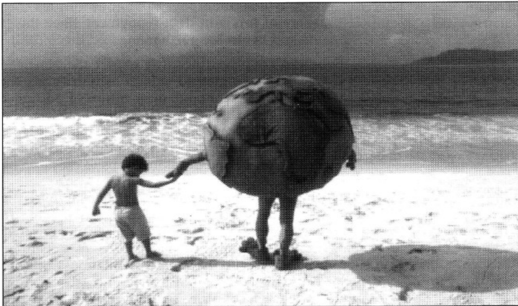
Figure 18.1 Looking to the future: the Earth Summit, Rio de Janeiro, 1992