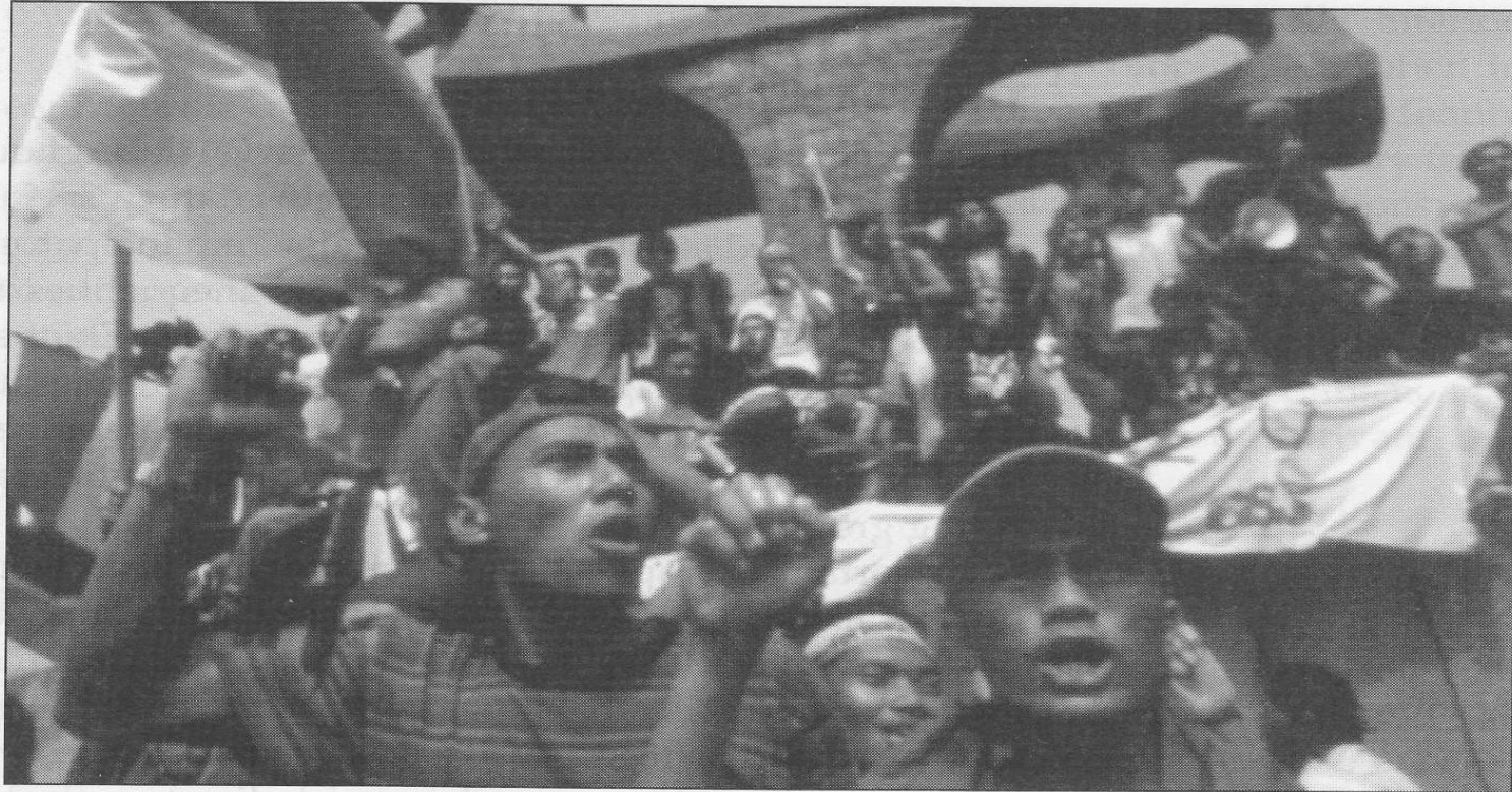
Figure 16.2 The student movement in Indonesia celebrates the removal of President Suharto, 1998