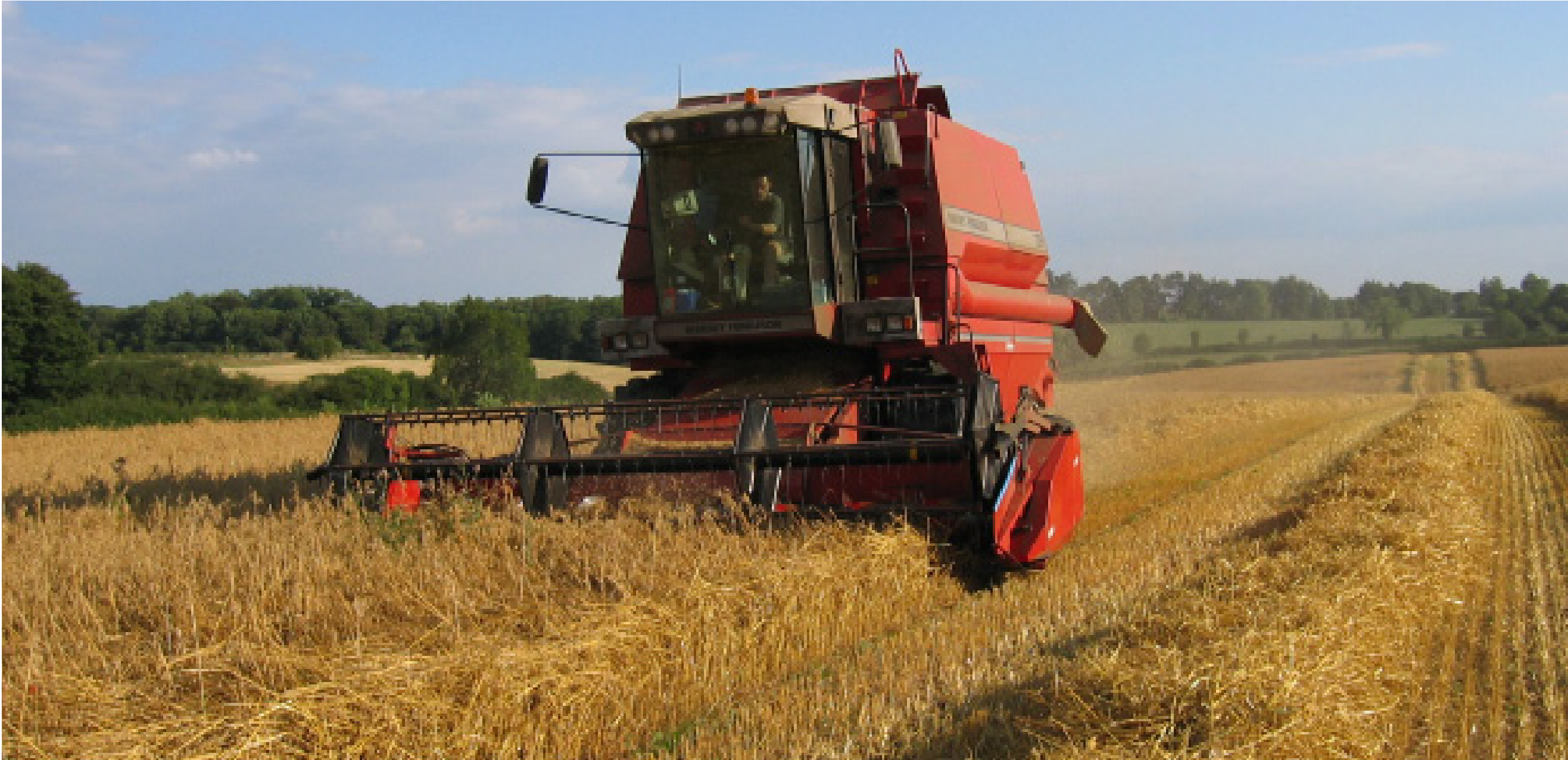
Slunečnice pochází zjižní a střední Ameriky, ale u nás zdomácněla už tak, jakoby tu byla odjakživa.

Lorem Ipsum je demonstrativní výplňový text používaný v tiskařském a knihařském průmyslu. Lorem Ipsum je považováno za standard v této oblasti už od začátku 16. století, kdy dnes neznámý tiskař vzal kusy textu a na jejich základě vytvořil speciální vzorovou knihu. Jeho odkaz nevydržel pouze pět století, on přežil i nástup elektronické sazby v podstatě beze změny.