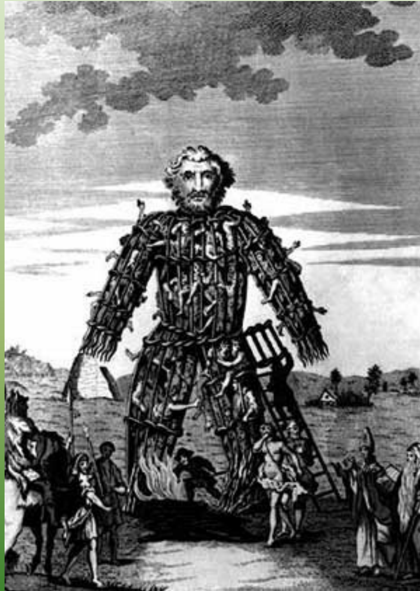
Dřevěná konstrukce používaná Kelty při obětních rituálech podle Cézara