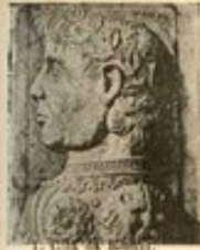
1. C. de B...