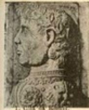
1. C. de B...