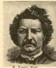
3. Louis B...