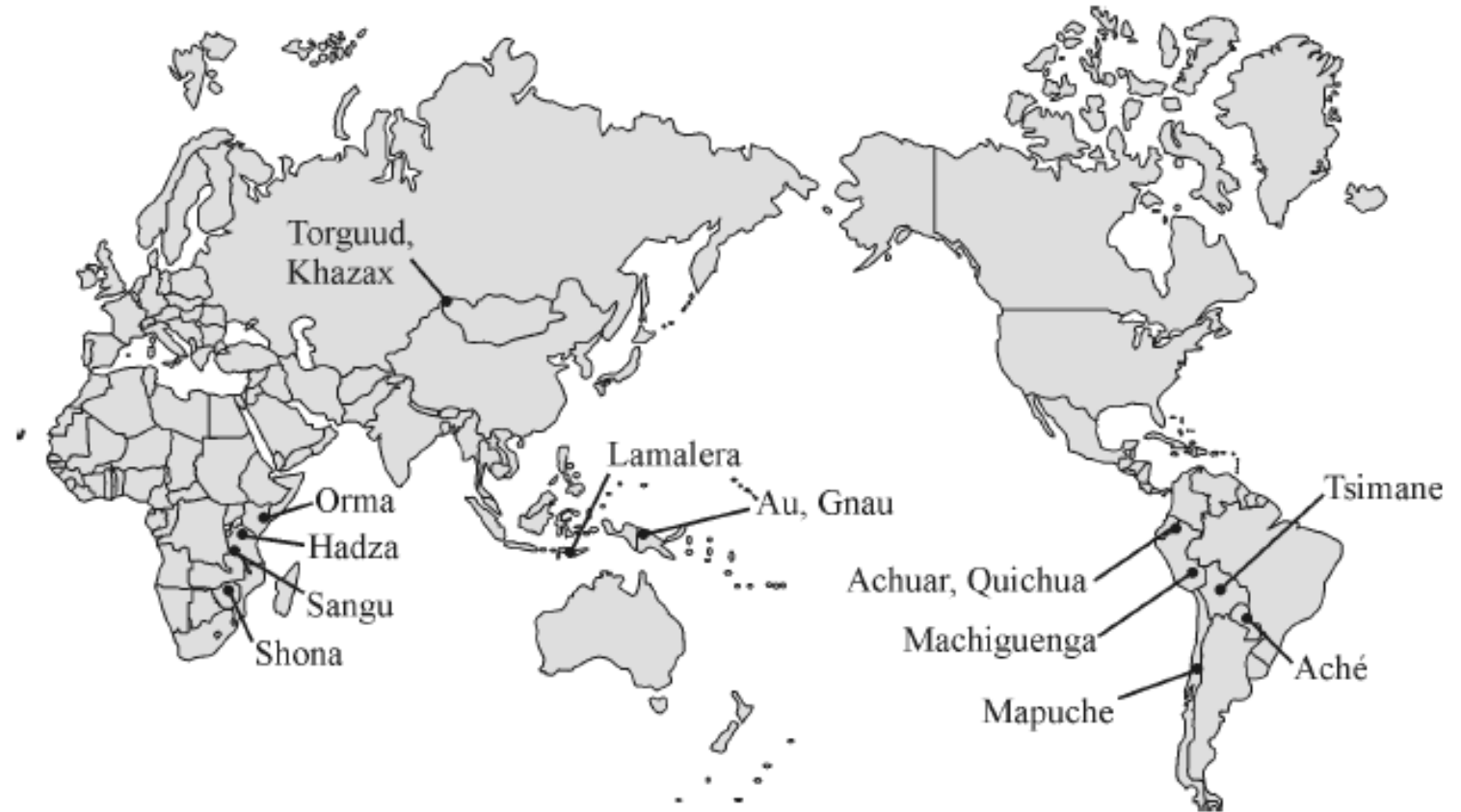
Figure 1. Locations of the 15 small-scale societies.