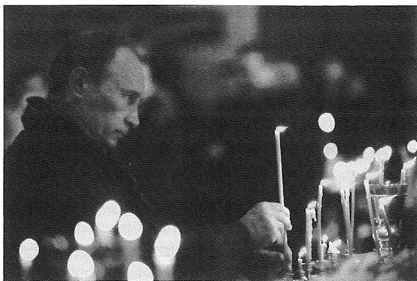
Vladimir Putin zapaluje svíci v pravoslavném chrámu.

vládne úzká skupina lidí, která čerpá zisky z prodeje surovin. Šéfem této obrovské benzinové pumpy je dodavatel paliva. Jediným cílem pragmatické ruské elity je jednoduše udržet se u moci a nepřijít o své zásoby surovin. Tato elita nehodlá umožnit rozvoj demokratických institucí, neklade si ani za cíl skutečnou modernizaci, neboť jedno i druhé by jen ohrožovalo její postavení. Ruské elity se tak buď mohou dělit s obyvatelstvem o zisky z obchodu s ropou, což se daří v období konjunktury, nebo se mohou odvolávat na postimperální trauma, což je nutné v období poklesu cen surovin. Vede to však k další paradoxní situaci. Na jedné straně elita potřebuje k udržení své pozice mobilizaci společnosti zajišťující protizápadní a nacionalistický kurz, na straně druhé stále potřebuje možnost obchodovat se Západem. Což vyžaduje udržování tohoto kurzu v určitých mezích. Rusko je tak odkázané na to hrát před svými obyvateli roli protizápadního impéria, ale nemůže ji sehrávat příliš přesvědčivě, aby nepřišlo o možnost obchodovat s nenáviděným Západem. Současné Rusko se tak ze své povahy musí pohybovat mezi vnitřní konsolidací a otevřeností navenek. V současné situaci jsme svědky prudkého mobilizačního smrštění, pro elity ovládající Rusko nezbytného vzhledem k ekonomické a sociální situaci, které však v delší časové perspektivě ohrožuje jejich vlastní zájmy.