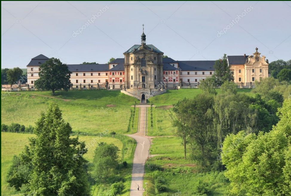
Práce s celou krajinou: Kuks