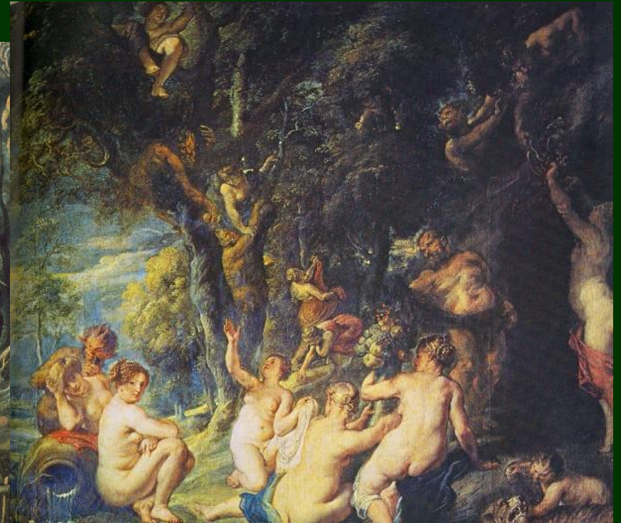
Petrus Paulus Rubens