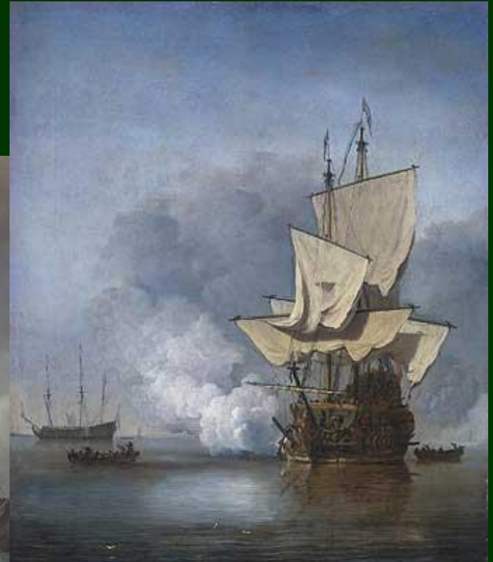
Willem van de Velde: The Cannon Shot (ca. 1670)