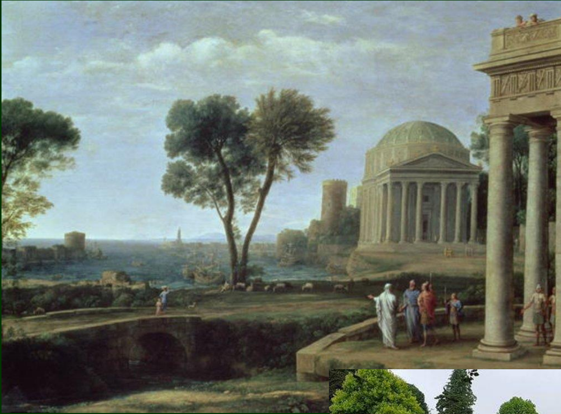
Detail of Landscape with Aeneas at Delos by Claude Lorrain