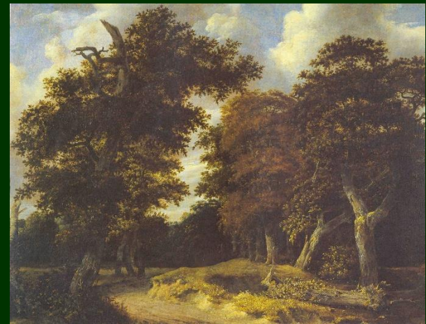
Jacob van Ruisdael