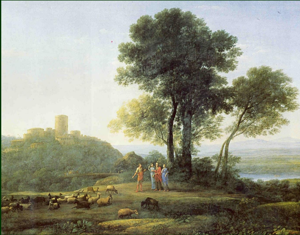
Lorrain: Landscape with Laban: Jákob a jeho dcery, 1676