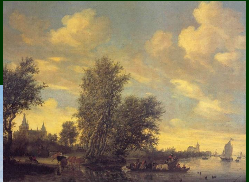
Salomon van Ruysdael: A River Landscape, 1649