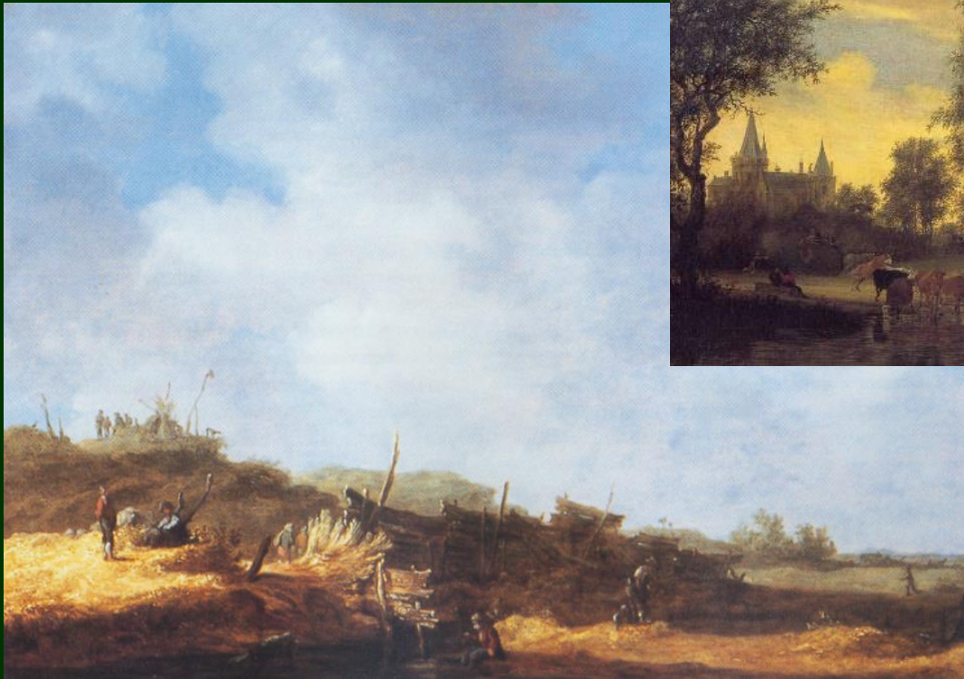
Jan van Goyen: Dunes