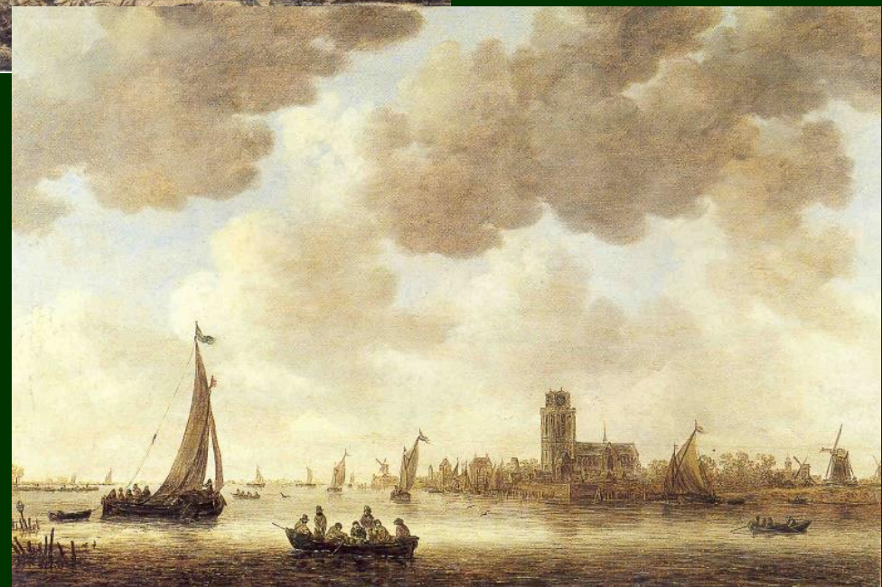
J van Goyen: A view of Dordrecht, 1647