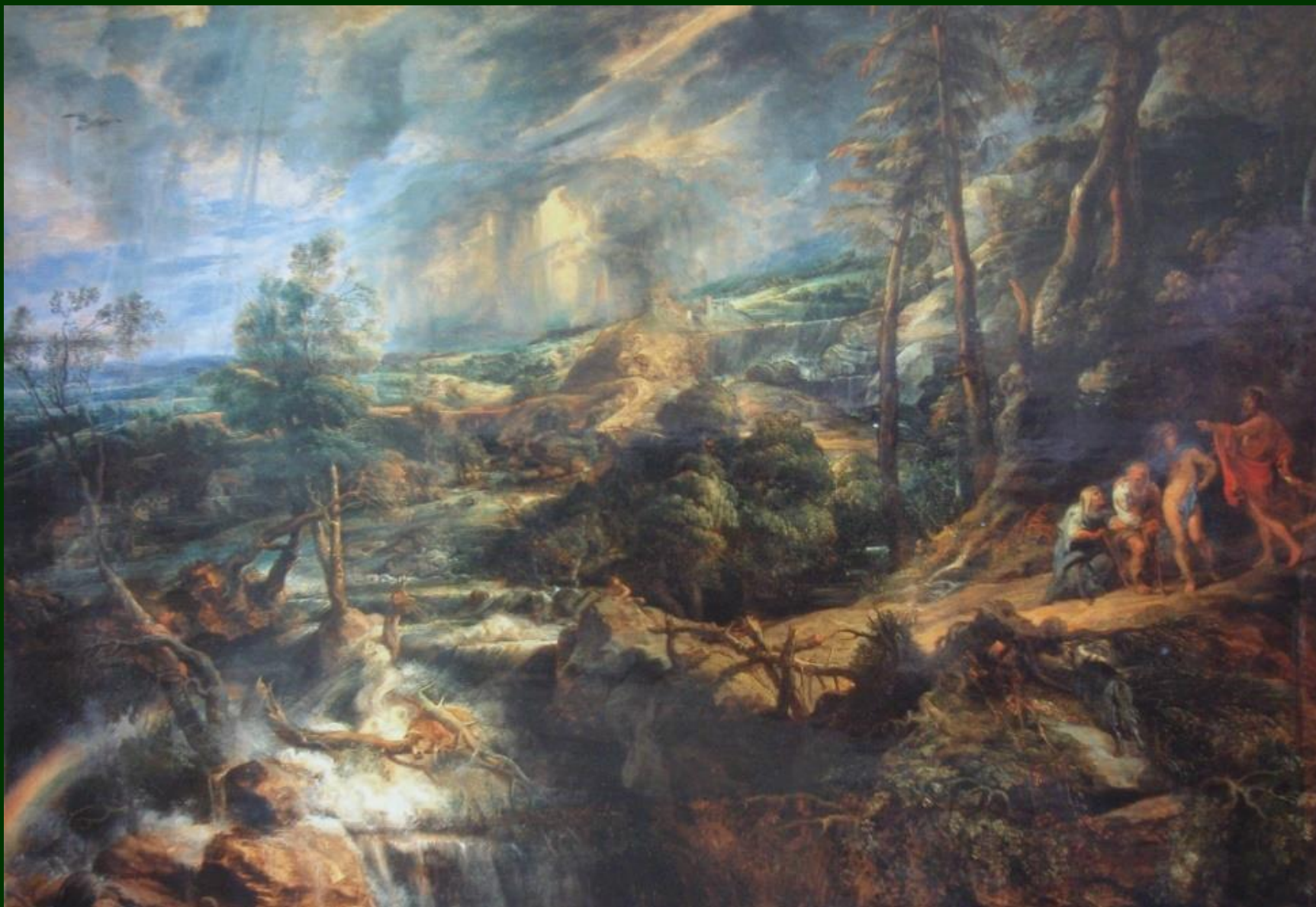
Rubens: Krajina v bouři s Filemónem a Baucis