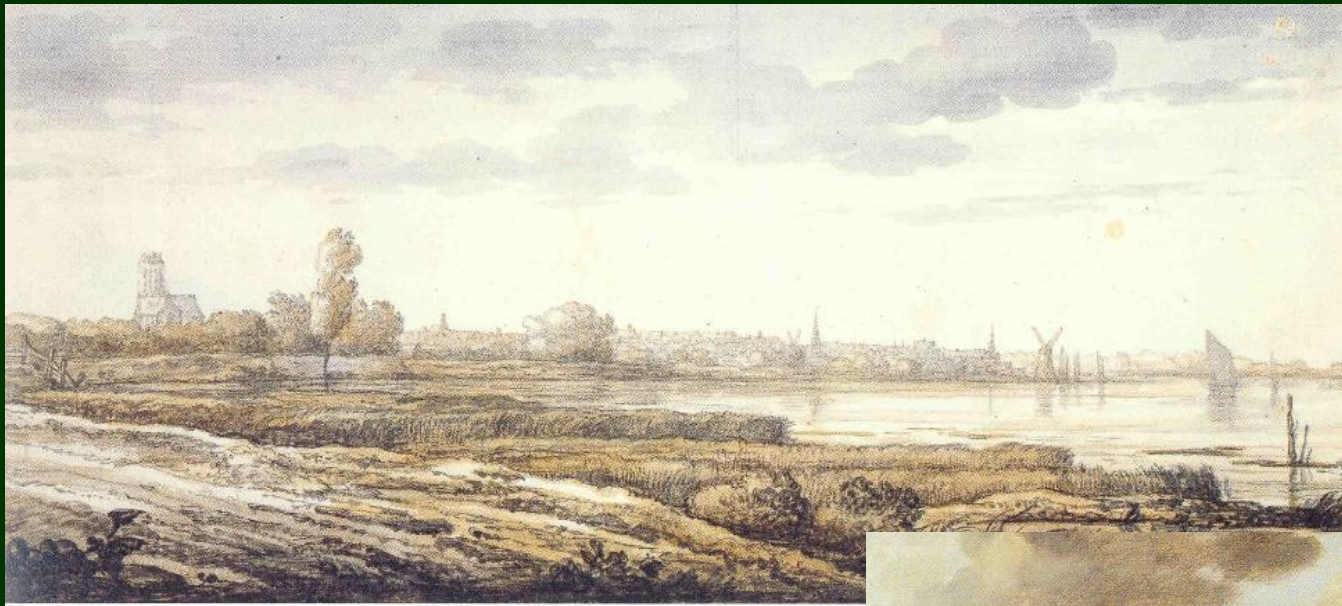
Aelbert Cuyp: A view of Dordrecht, 1655