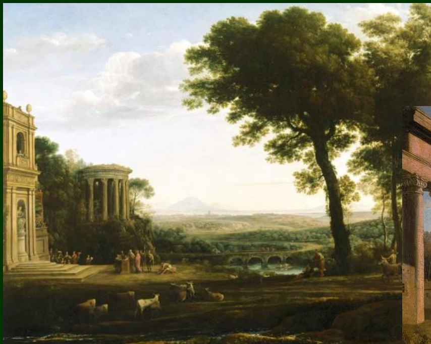
Krajina s obětí Apollónovi