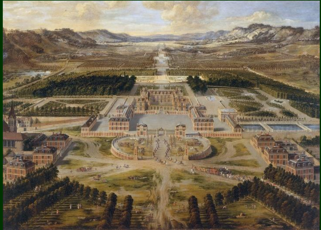
Chateau de Versailles 1668 Pierre Patel