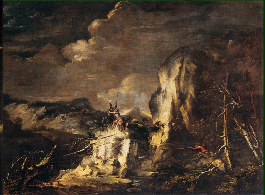
Salvatore Rosa: Rocky Landscape with a Huntsman and Warriors