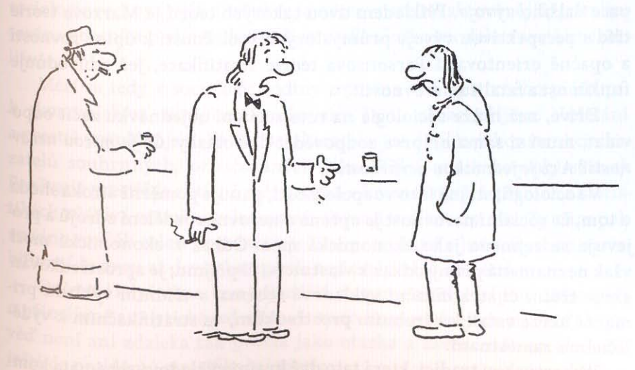
NESTASTNOU NAHODOU JSEM SE PRIZENIL DO SLUSHE RODINY .