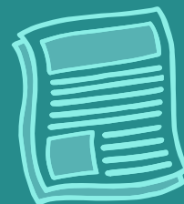
Novinárka, editorka, HN