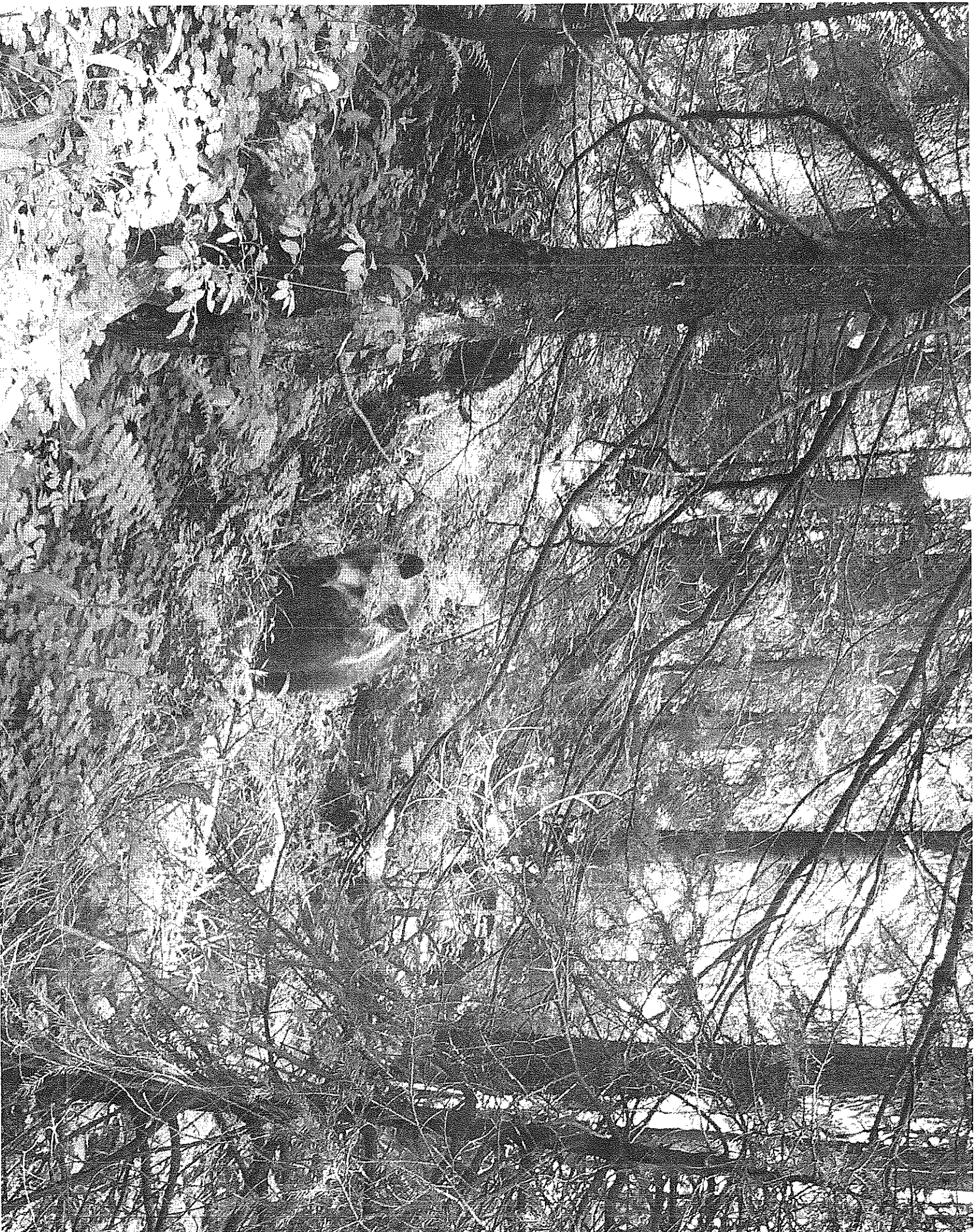
Takhle vypadá ráj medvěďů.