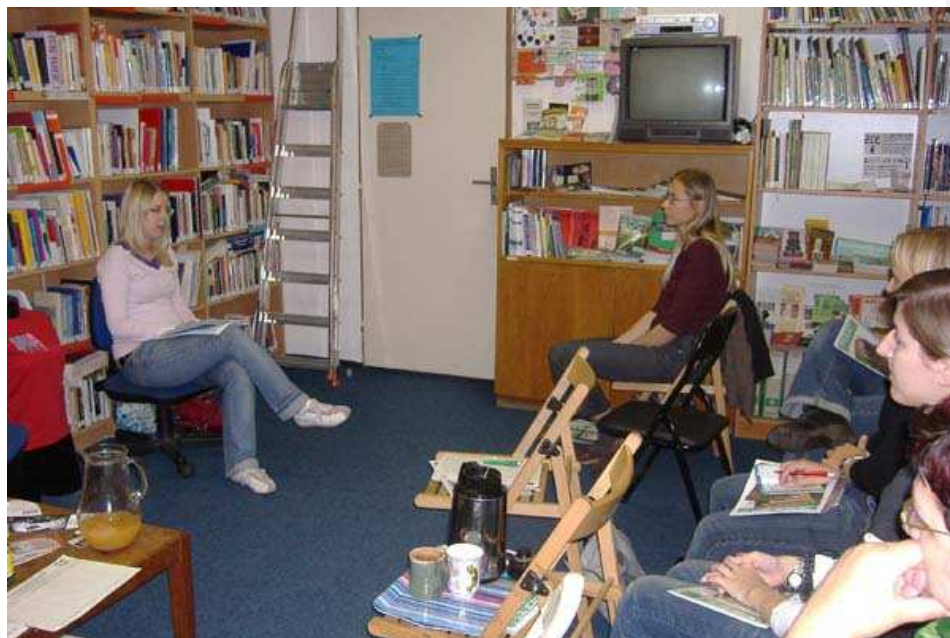
26. Fotka z přednášky o násilí na ženách