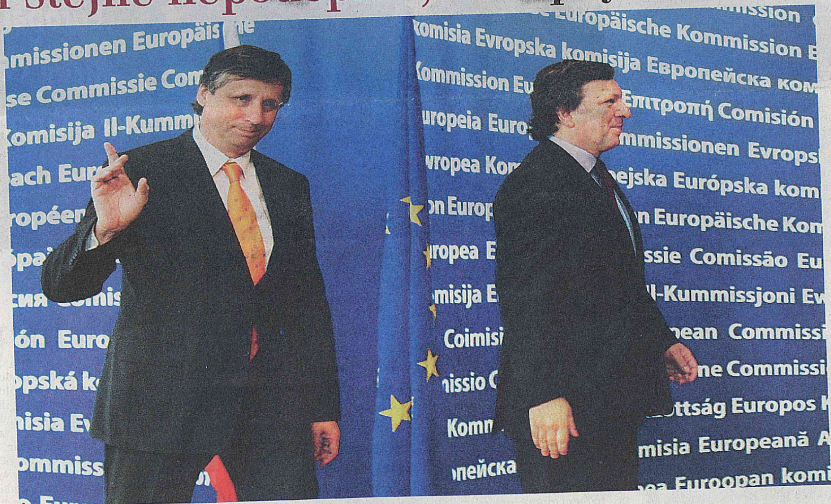
Nucené úsměvy. Český premiér Jan Fischer předsedu Evropské komise Josého Barrosa Klausovými požadavky k Lisabonu nepotěšil.

tvrzením přišel na informací i jeden ěmeckých deníků o stejně nepodepí- ý Klaus již počát- vštěvě saského pre- a Tillicha v Praze. ropské komise José o schůzce s premié- cherem vyzval Pra- a schvalování Lis- y další „umělé pře- no také pohrozil, že blika nemusela mít isaře. Protože „jedi- a, jak to zaručit, je lisabonskou smlou-