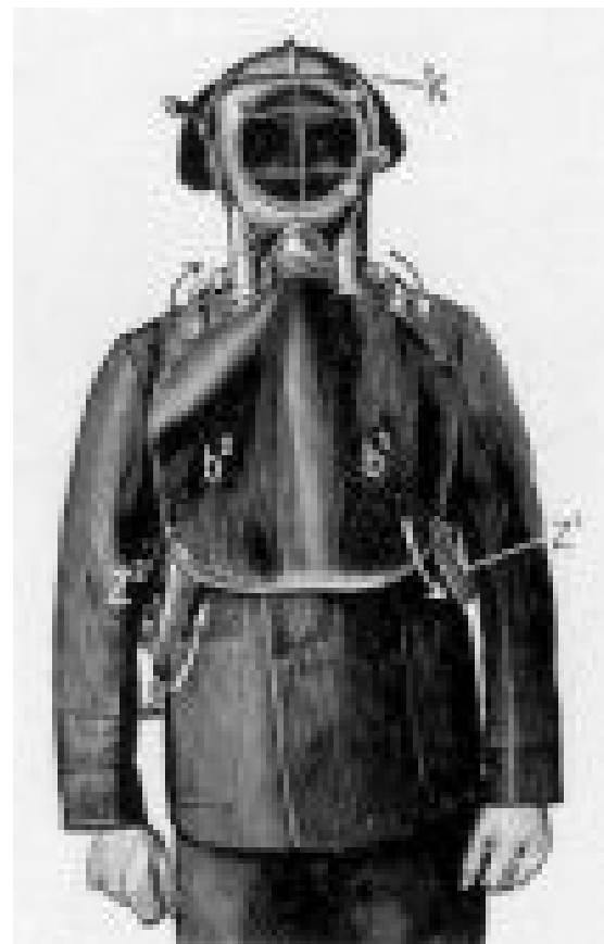
Přístroj Dräger model 1904/1909