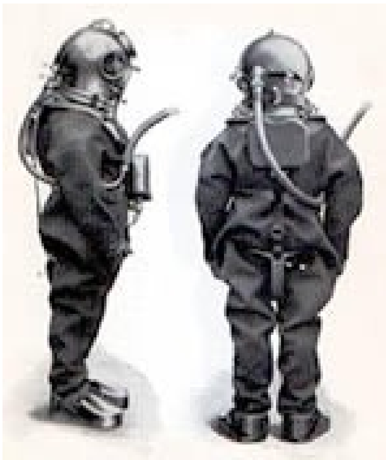
Skafandr z r. 1865

Vzorem pro důlní záchranné přístroje se staly potápěčské přístroje