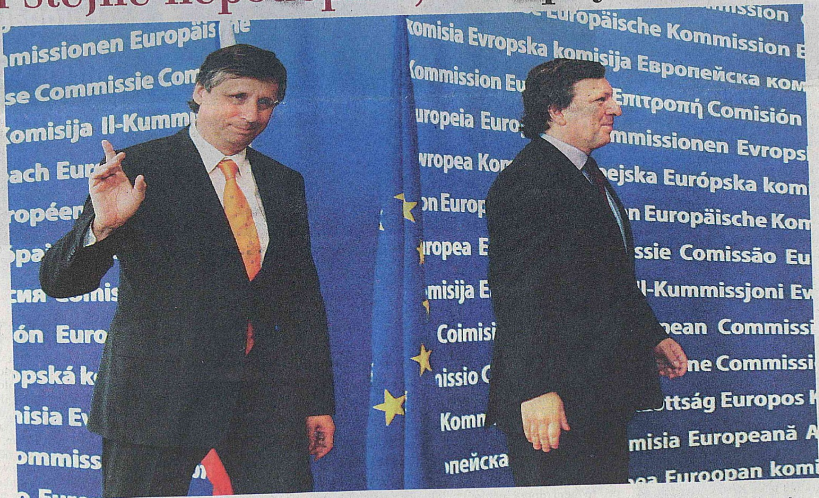
Nucené úsměvy. Český premiér Jan Fischer předsedu Evropské komise Josého Barrosa Klausovými požadavky k Lisabonu nepotěšil.

tvrzením přišel na informací i jeden ěmeckých deníků o stejně nepodepí- ý Klaus již počát- vštěvě saského pre- a Tillicha v Praze. ropské komise José o schůzce s premié- cherem vyzval Pra- a schvalování Lis- y další „umělé pře- no také pohrozil, že blika nemusela mít isaře. Protože „jedi- a, jak to zaručit, je lisabonskou smlou-