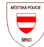
1992 – 1993