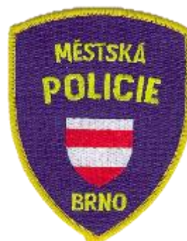
Rukávová nášivka /u každé obce jiná/