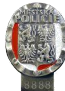
Služební odznak s číslem