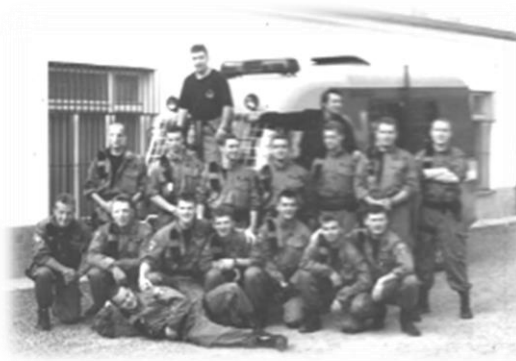
Jednotka operativního zásahu