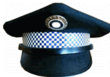
Šachovnice na pokrývce hlavy