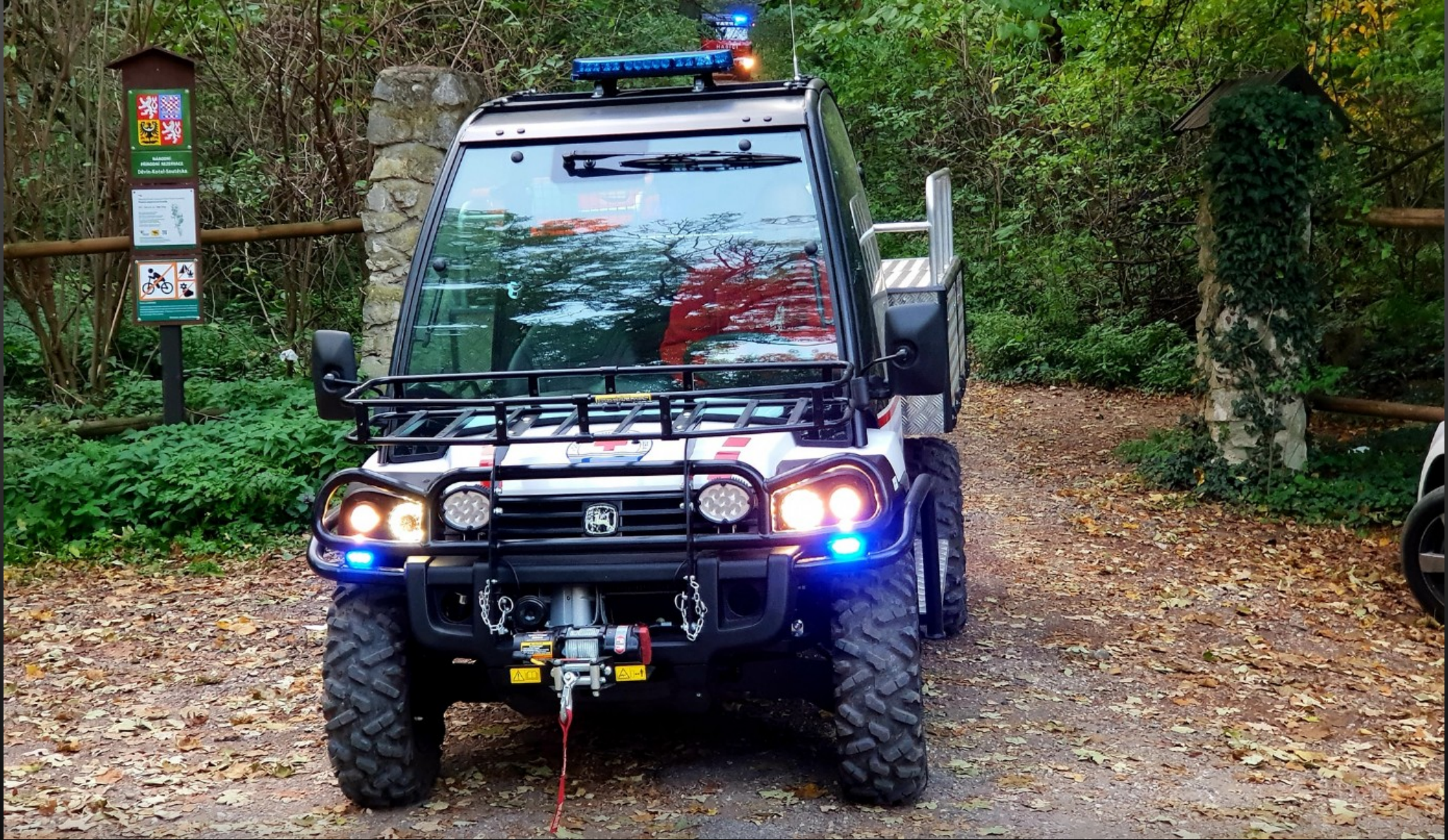
John Deere Gator