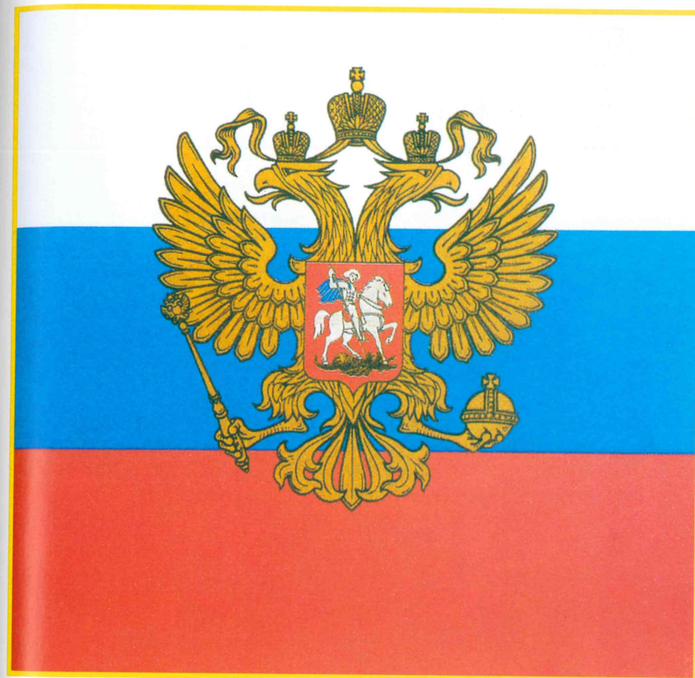
4. Prezidentská standarta Ruské federace.