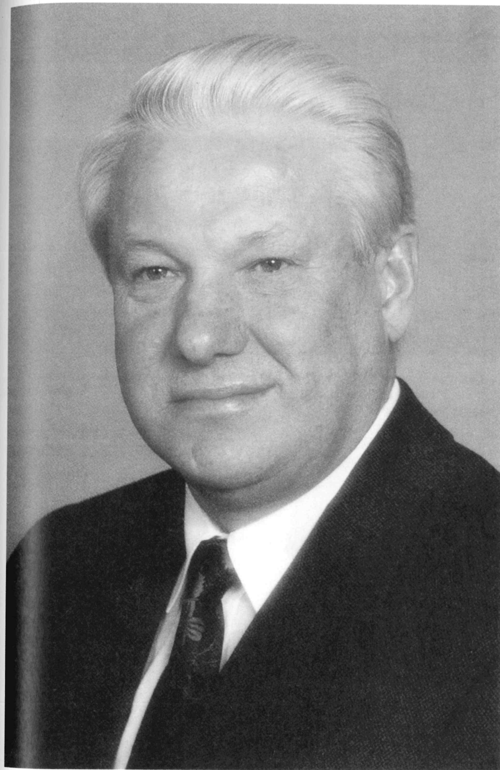
1. Boris Jelcin, ruský prezident 1991–1999.

Jinak se politici pohybovali po linii určené od roku 1993. Mezi prezidentskými