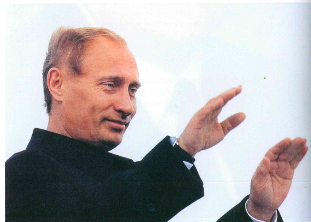
3. Vladimir Putin, ruský prezident od roku 2000.