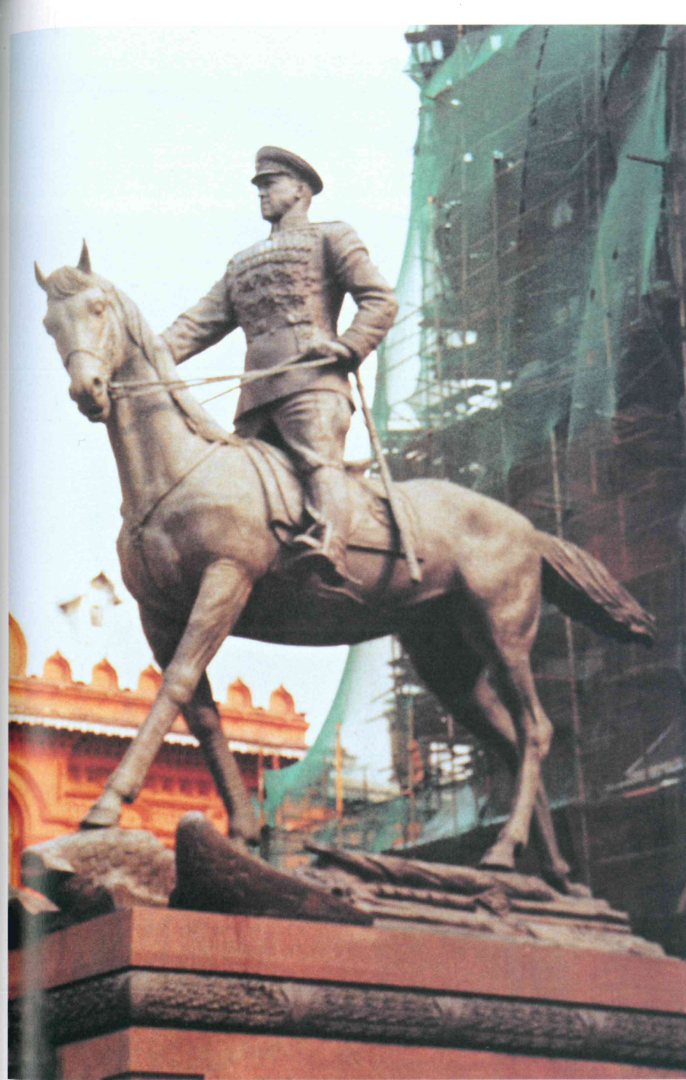
6. Socha maršála Žukova vztyčená roku 1994.