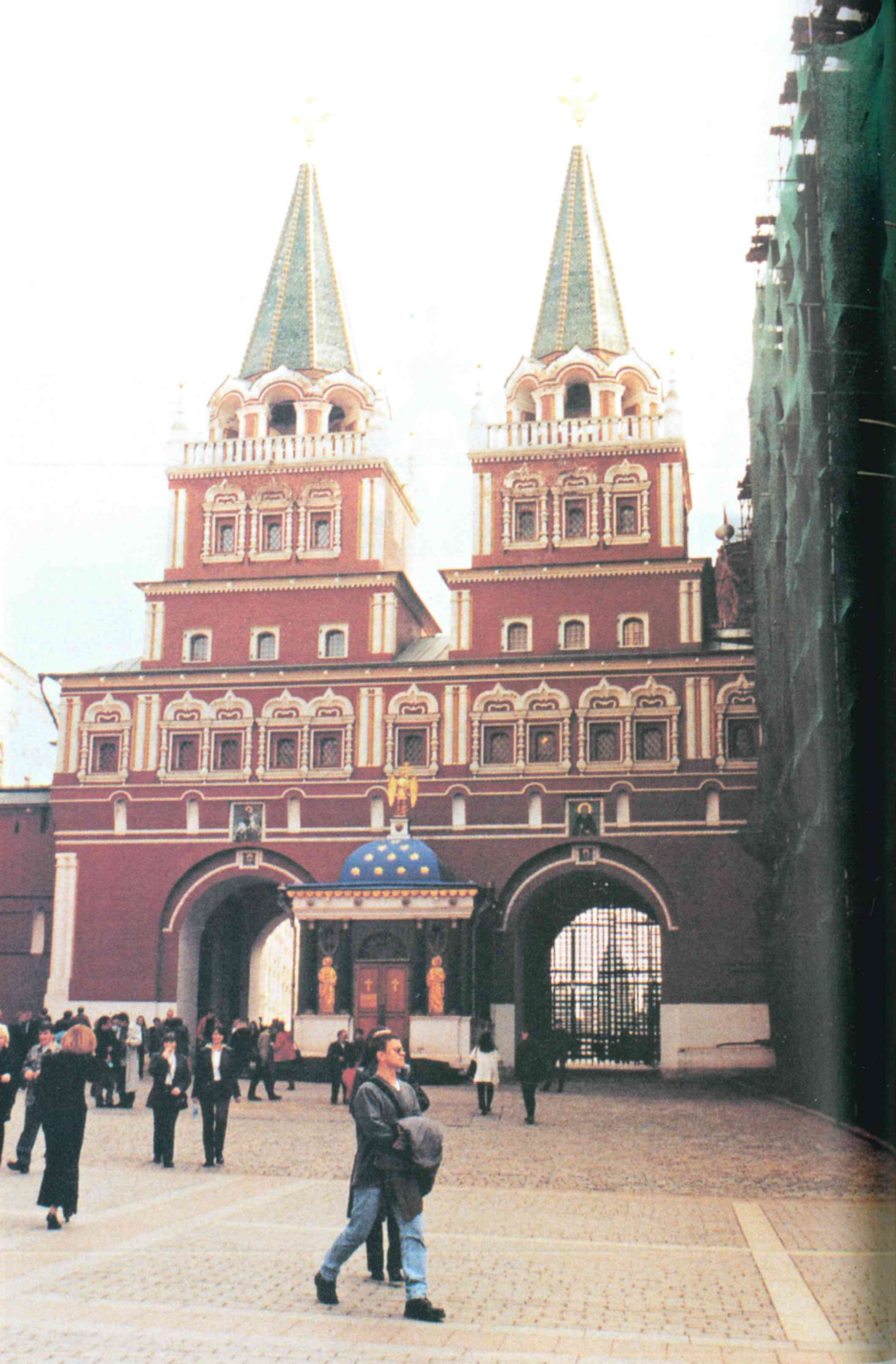
5. Nová brána na Rudé náměstí.