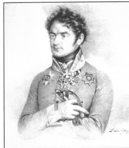
Karl Friedrich von Langenau převzal velení rakouského dělostřelectva u Drážďan po raněném Václavu Frierenbergerovi, známém i z bitvy u Slavkova

U Budyšína 20. a 21. května 1813 se mohl znovu zopakovat Slavkov a rozdrčení celé spojenecké rusko-pruské armády, avšak Neyovi ten den chyběl smysl pro strategické uvažování, vždy byl spíše energickým velitelem v poli, někdy nebyl schopen vidět dál než na jeden konkrétní úder a další dny nepromýšlel do takové hloubky, v mladším věku se to někdy projevovalo zbrklostí, ve starším občasnou váhavostí. Nic to neubíralo na maršálově statečnosti, ale velet velkým armádním celkům bylo hodně náročné a tento úkol jej někdy přesahoval. Navíc i sám Napoleon už nebyl v tomto období tak brilantním jako v dřívějších dobách, sám kdysi říkal, že Francie nesmí válčit tak často, jinak své vojenské umění naučí i své soupeře. Francie však válčila prakticky neustále už více než 20 let a nepřítel se rychle učil ze svých chyb z dob, kdy francouzským schopnostem ve vedení války v mnoha směrech nestačili.