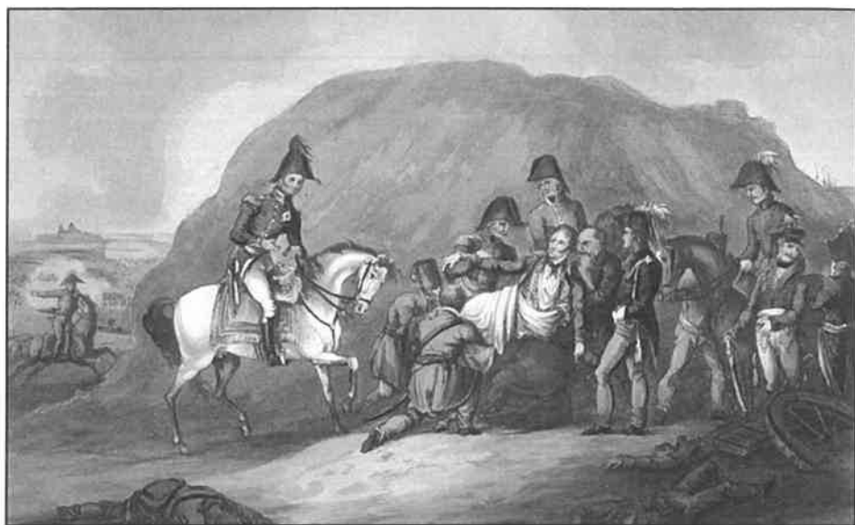
Smrtelné zranění Moreaua

jen svými počty a na papíře a skládala se z nezkušených branců, schopných nižších důstojníků mnoho nezůstalo a nejhorší to bylo s kavalerií, která byla v Rusku téměř celá zničena. To omezené množství jezdců, kterými nyní Napoleon disponoval, bylo navíc složené z nezkušených nováčků. Napoleon i tak ihned dosáhl několika důležitých vítězství a spojenecké armády pozvolna ustupovaly.