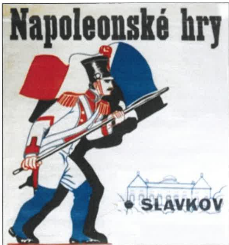
Propagační materiály k I. ročníku Napoleonských her ve Slavkově, které se konaly před 90 lety, 10. září 1933 (z archivu Fr. Kopeckého)