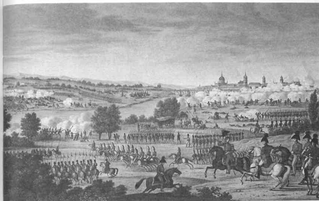
Veduta Drážďan v bitevní vřavě

Spojenectví Ruska a Švédska během Napoleonova katastrofálního ruského tažení předznamenalo vznik šesté protifrancouzské koalice, do které vstoupily Prusko, Velká Británie, a nakonec i Rakousko. Postupně tedy i všechny jednotlivé země, které byly nuceny vyslat kontingenty na