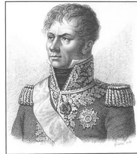
Napoleonův maršál Gouvion Saint-Cyr prokázal u Drážďan své kvality

U Budyšína tak kvůli tomu, že Neyovy jednotky postupovaly váhavě a promeškaly správný okamžik, spojenecká armáda stihla relativně spořádaně ustoupit. Ney se snažil o dobytí jednoho místa pruského úseku obrany a nepřehradil ustupujícím cestu. Po bitvě u Luckau bylo na začátku června podepsáno příměří, které trvalo jen do srpna 1813, šlo o pouhý oddechový čas před dalším tažením. Francouzská armáda přitom byla v ten moment na pochodu k Berlínu a teoreticky se mohl zopakovat rok 1806, obě strany se však domnívaly, že nutně potřebují oddech (u Napoleona šlo zejména o příležitost, jak lépe vycvičit nezkušenou jízdu), a proto uzavřely toto dočasné příměří. I sám Napoleon zpětně tento krok hodnotil jako velkou chybu, protože to byl on, kdo měl v ten moment iniciativu na své straně a umožnil příměřím soupeři znovu načerpat síly.