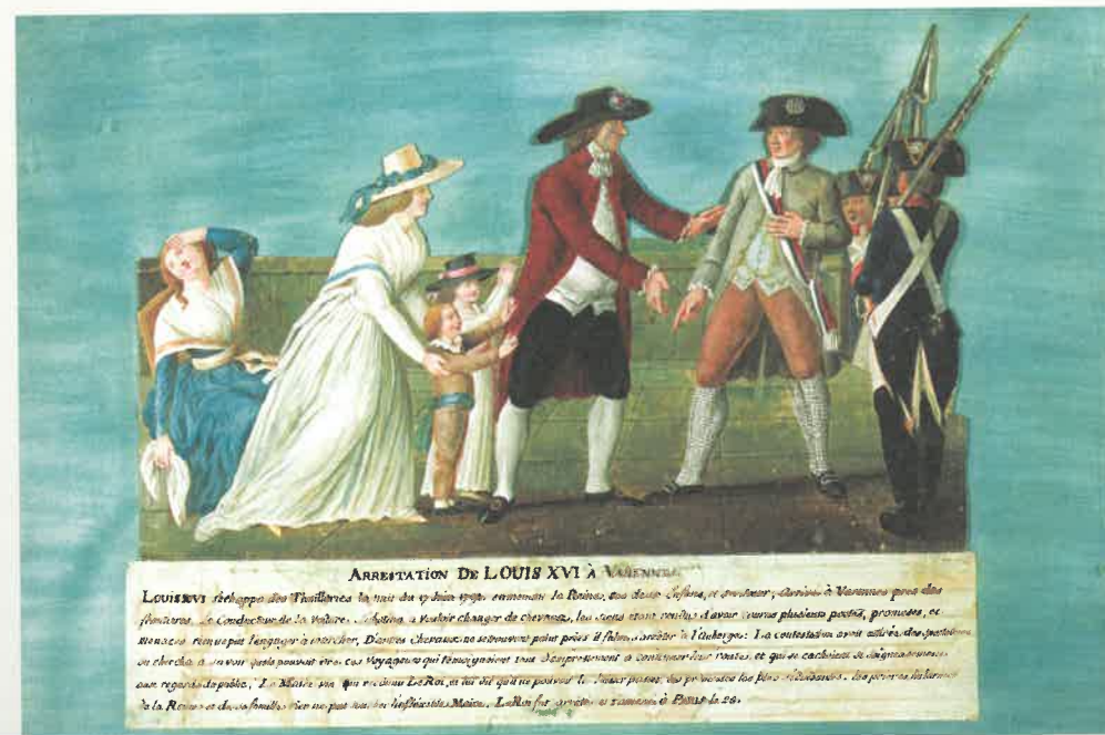
MNOHÍ VÝZNAMNÍ EVROPŠTÍ MYSLITELÉ SE DOMNÍVALI, ŽE FRANCOUZSKÝ KRÁL LUDVÍK XVI., KTERÝ JE NA TOMT OBRÁZKU PŘÁVĚ SPOLL SE SVOU RODINOU ZAT KÁN, SI VLASTNÍ OSUD ZAVINIL SÁM, PROTOŽE ODMÍTAL ZAVÉST PONĚ KUD OSVÍCENĚJŠÍ FORM MONARCHIE.

1802: březen: Velká Británie podepisuje v Amiens mír, čímž končí období francouzských revolučních válek.