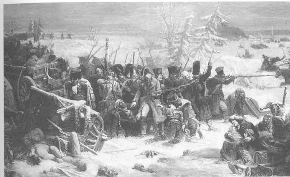
BĚHEM ÚSTUPU OD MOSKVY SE SKUPINA MUŽŮ POD VEDENÍM MARŠÁLA MICHELLE NEYE ODDĚLILA OD HLAVNÍ ARMÁDY A BYLA DÍKY TOMU LEHCE ZRANITELNÁ. BYLI JEDNI Z MÁLA, KTERÍ PŘEŽILI SOUSTŘEDĚNÝ RUSKÝ ÚTOK.

Když se Napoleon dozvěděl o pokusu o převrat, který v Paříži provedl generál Claude-Francois de