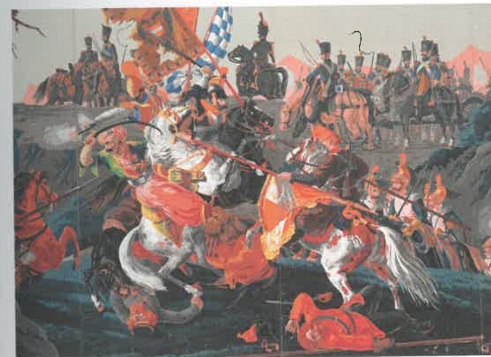
BITVA U SLAVKOVA JE NĚKDY OZNAČOVÁNA ZA NAPOLEONOVU „PERFECTNÍ BITVU“. DÍKY TOMUTO OBRÁZKU JE MOŽNÉ ZÍSKAT PŘEDSTAVU O TOM, JAK VYSOKOU DAŇ SI NAPOLEONŮV VOJENSKÝ GÉNIUS VYBRAL V ŘADÁCH RAKOUSKO-RUSKÉHO VOJSKA.

Po této bitvě, kterou historici někdy nazývají Napoleonovou „perfektní bitvou“, se Rusové museli vrátit domů a Rakušané byli přinuceni prosit o uzavření míru a udělat četné ústupky. O dvacet dnů později postoupilo Rakousko Francii rozsáhlá území tzv. Prešpurským (Bratislavským) mírem. Prusko, které uvažovalo o tom, že by se mohlo k Rakousku a Rusku ve válce proti Napoleonovi připojit, nyní s Francií raději podepsalo mírovou smlouvu, a Třetí koalice tak přestala existovat.