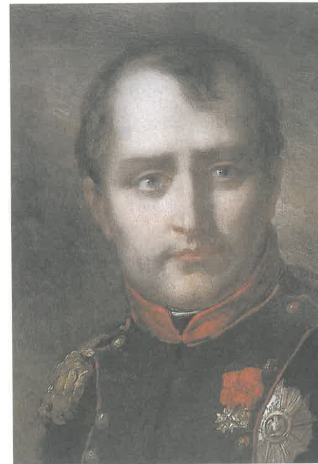
PRUD'HONSŮV POSLEDNÍ PORTRÉT Z ROKU 1810 ZACHYCUJE NAPOLEONA BONAPARTA NA VRCHOLU SLÁVY. V ROCE 1810 KONTROLOVAL NAPOLEON PRAKTICKY CELOU ZÁPADNÍ EVROPU VČETNĚ ITÁLIE A VELKÝCH ČÁSTÍ NĚMECKA.

Důsledky napoleonských válek byly dalekosáhlé. Je ironií osudu, že zatímco ve Francii se po návratu Bourbonů vrátily věci do starých kolejí, Napoleonova snaha působit na nacionalismus Francouzů přinesla největší výsledky v zemích, které byly nepřáteli Francie. Hnutí za nezávislost se objevila v Rusku, Německu i dalších zemích, včetně Jižní Ameriky (po pádu španělského impéria) a Řecka (viz „Válka za řeckou nezávislost“, str. 50). Tato nacionalistická hnutí byla nakonec úspěšná a ve 20. století měla pozměnit rovnováhu sil v Evropě i ve světě.