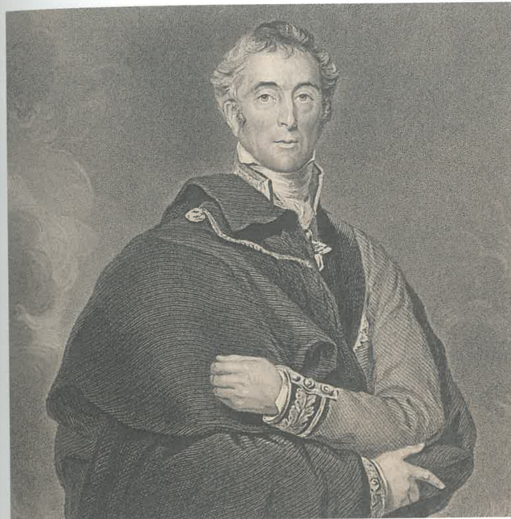
ŽIVOT ARTHURA WELLESLEYHO, VÉVODY Z WELLINGTONU, JE MOŽNÉ DO URČITÉ MÍRY PŘIROVNAT K ŽIVOTU NAPOLEONA BONAPARTA. OBA SVÉ GENIÁLNÍ SCHOPNOSTI PROKÁZALI UŽ V ÚTLÉM VĚKU A MĚLI O SOBĚ PODOBNĚ VYSOKÉ MÍNĚNÍ. TO Z NICH DĚLALO IDEÁLNÍ PROTIVNÍKY.

Přestože se Wellington o Waterloo vyjadřoval jako o „běhu na krátkou vzdálenost“, unavený Napoleon, který zde stál proti němu, už nebyl tím starým Napoleonem a bitevní pole zcela ovládla