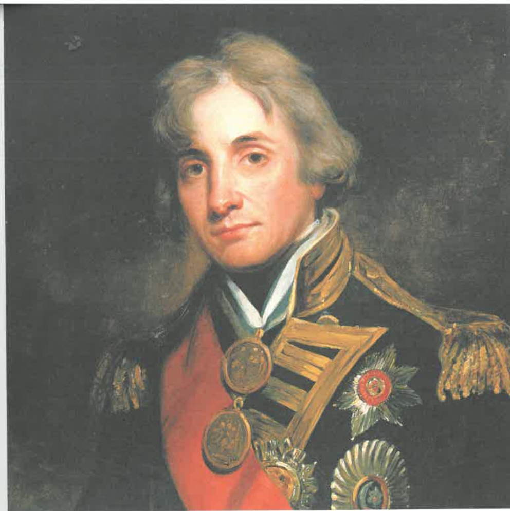
SCHOPNOST LORDA ADMIRÁLA HORATIA NELSONA OKOUZLIT VŠECHNY KOLEM SEBĚ – NÁMOŘNÍKY, ŽENY (VČETNĚ MANŽELEK JINÝCH MUŽŮ) I BRITSKOU VEŘEJNOST – BYLA LEGENDÁRNÍ.

Nelson byl velký individualista a jeho taktické uvažování bylo svérázné. Do značné míry se spolehal na své podřízené, kterým ponechával vel-