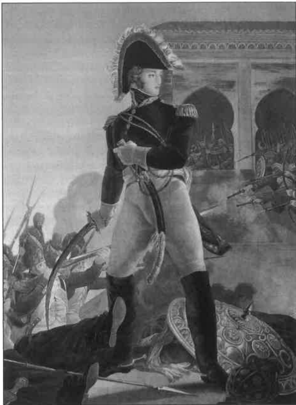
Davout v Egyptě

naplno věnovat vojenskému řemeslu. Vyznamenal se při obléhání pevnosti Lucemburk. V roce 1795 v pokračující válce s Rakušany padl ve svém životě jedinkrát do zajetí, za čestný výměny zajatců bojovat proti Rakušanům, však byl záhy propuštěn a vrátil se domů. V roce 1796 se poté opět vrací k armádě na Rýně.