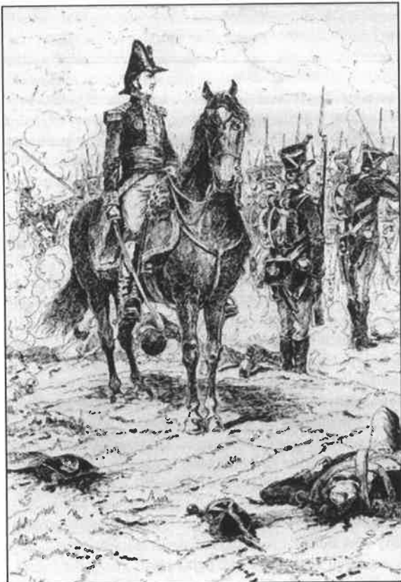
Davout u Auerstädtu

místech se však bitva zdaleka nevyvíjela tak dobře. Nešťastný byl zejména osud sboru maršála Augereaua, který v mizerné viditelnosti ztratil správný směr a vynořil se přímo před početnou baterií ruských děl, byl rozstřílen na kusy a prakticky zničen. Před porážkou Napoleonovu armádu zachránil masivní útok kavalerie více než 10 tisíc jezdců seřazených v řadách za sebou vedených maršálem Muratem. Ney i Davout mezitím stabilizovali pravé i levé křídlo bojiště a v noci se začala ruská armáda společně s malým pruským sborem stahovat na sever. Válka i přes okolo 50 tisíc mrtvých a raněných na obou stranách v této bitvě pokračovala dál, protože se jednalo pouze o krvavou remízu.