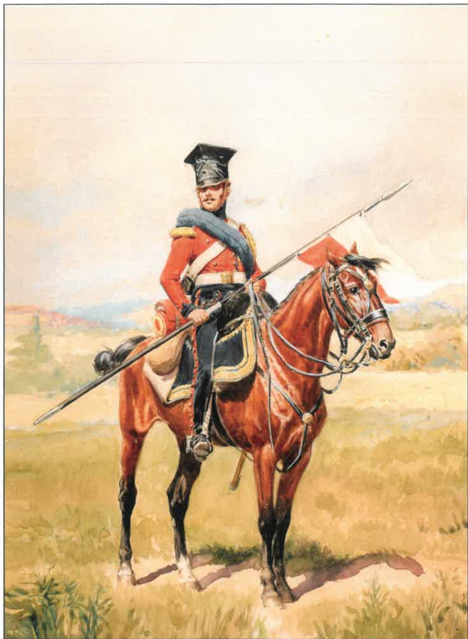
Hulán Holandského království (1810)