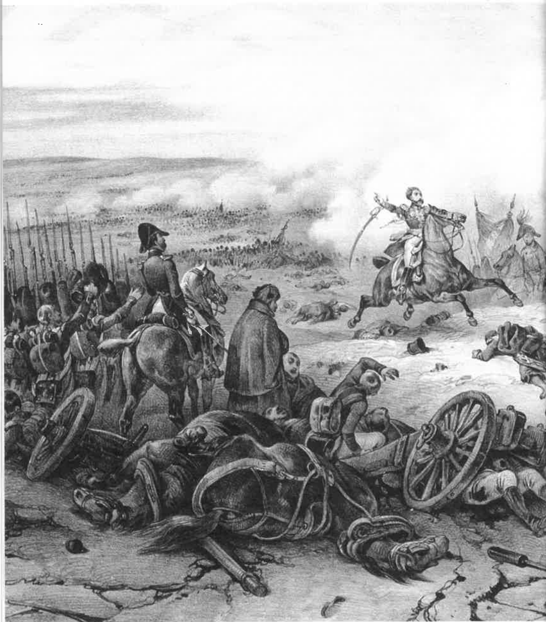
Bitva u Slavkova