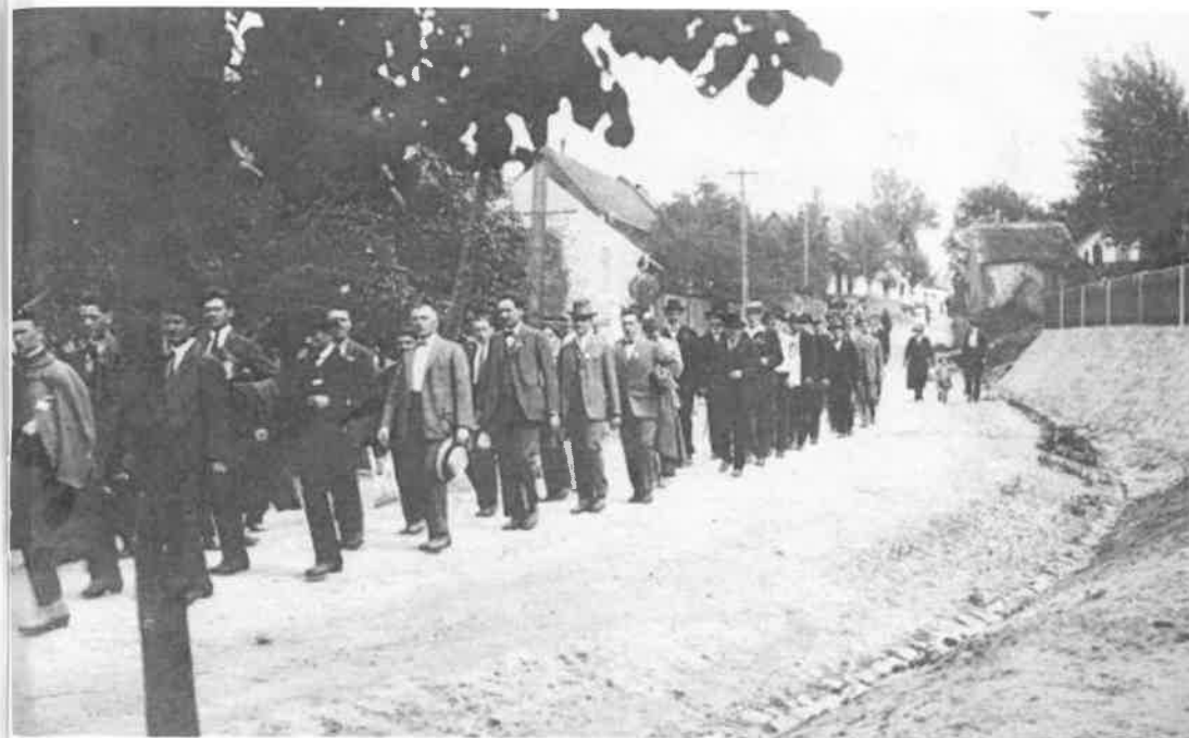
Pohřeb Emila Kalába 13. března 1932