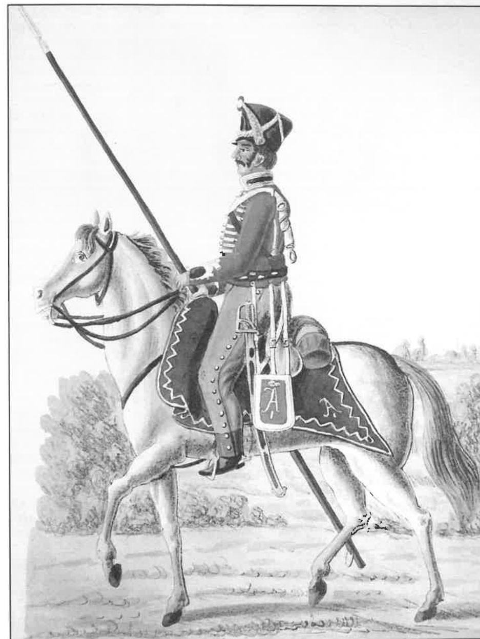
Ruský husar s neobvyklou zbraní - hulánskou pikou (Izjumský 11. pluk)

Bitva u Slavkova skončila triumfálním francouzským vítězstvím. Ztráty byly velké na obou stranách, padlých raněných a zajatých spojenců však bylo násobně více, přes 21 tisíc. Spojenci přišli také o více než 100 děl. U Francouzů šlo o něco přes 8 tisíc mužů. Statistiky se dodnes trochu rozcházejí! Rakousko bylo nuceno po bitvě žádat o velmi nevýhodný mír, Rusko ve válce, byť silně oslabené, pokračovalo. Jedním z důsledků bitvy bylo, že roce 1806 prohlašuje rakouský císař František I. Svatou říši římskou za definitivně rozpuštěnou, protože ztratila vliv a účel. Sám byl tedy jejím posledním císařem (jako František II.). V dalším roce se přidalo do války proti Napoleonovi i Prusko, bylo však rychle rozdraceno, definitivní porážka Rusů přišla v roce 1807 v bitvě u Friedlandu. Bitva u Slavkova dala Napoleonovi téměř dekádu vojenské dominance na kontinentě, postupně ukončenou až jeho megalomanskými vizemi a taženými rozkročenými od španělského Madridu, Cádizu či portugalského Porta až po ruskou Moskvu, ve kterých již nešlo kvůli řadě faktorů zvítězit. Jeho soupeři se navíc rychle učili a v mnoha případech reformovali své armády podle francouzského vzoru. Týkalo se to i již zmíněné pozice náčelníka štábu.