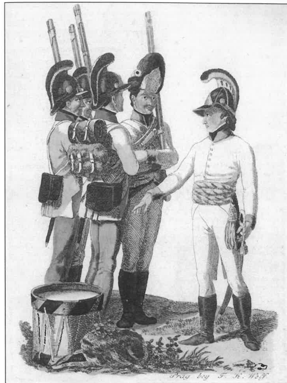
Uherští pěšáci, granátník a důstojník

Dále se také nabízí trefný postřeh pana profesora Uhlíře, který ve své vynikající monografii Slunce nad Slavkovem glosoval tvrzení Napoleonovy propagandy, že z děl ukořistěných u Slavkova byl odlit Vendômský sloup. Podle pana profesora šlo o vědomou nepravdu. Ke zbudování sloupu vysokého 43,5 metru by bylo potřeba nejméně tisíce děl, tolik kanónů spojenci u Slavkova ani zdaleka neměli, natož aby jich takové množství Francouzi v tomto střetu ukořistili. Surovinu pro takto monumentální památník vítězné bitvy u Slavkova získal Napoleon patrně po obsazení Vídně ve zdejších Arsenalu či ještě někde jinde, nemuselo ani nutně jít o kořistní