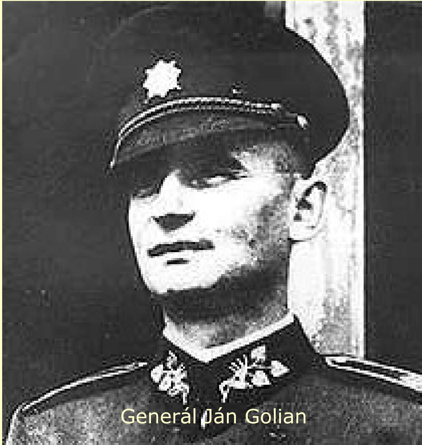
Generál Ján Golian