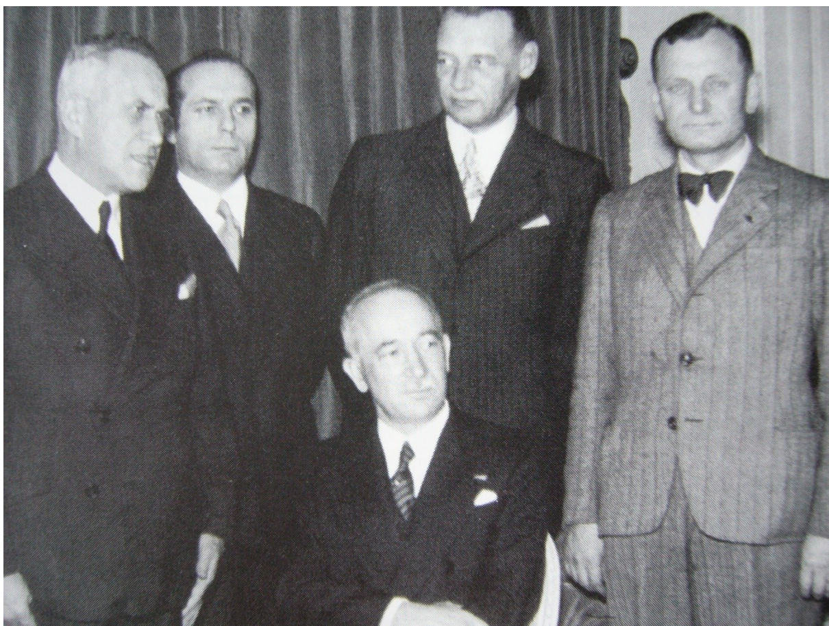
Formující se základ exilové vlády (Francie 1939)