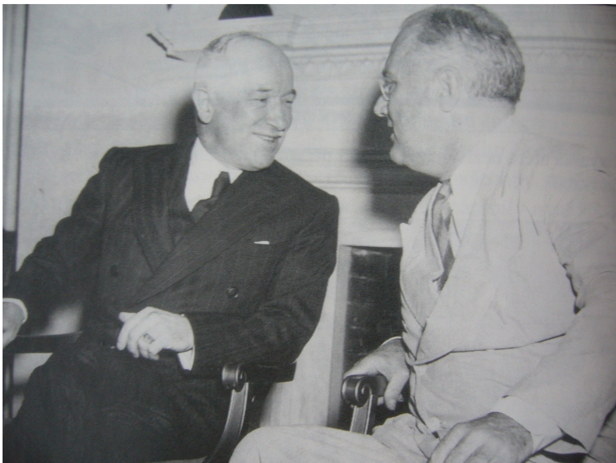
S presidentem USA F. D. Rooseveltem