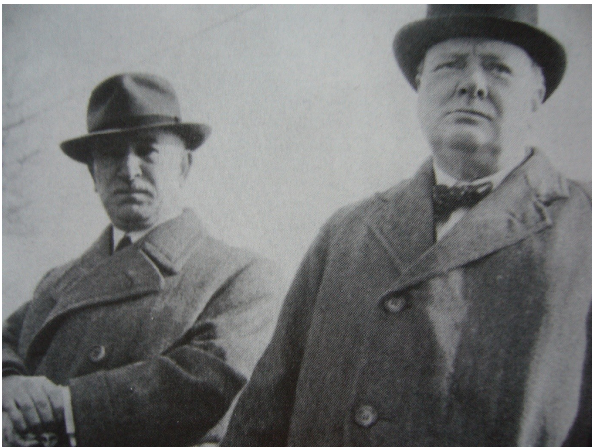
Edvard Beneš s blízkým spojencem Československa W. L. S. Churchillem