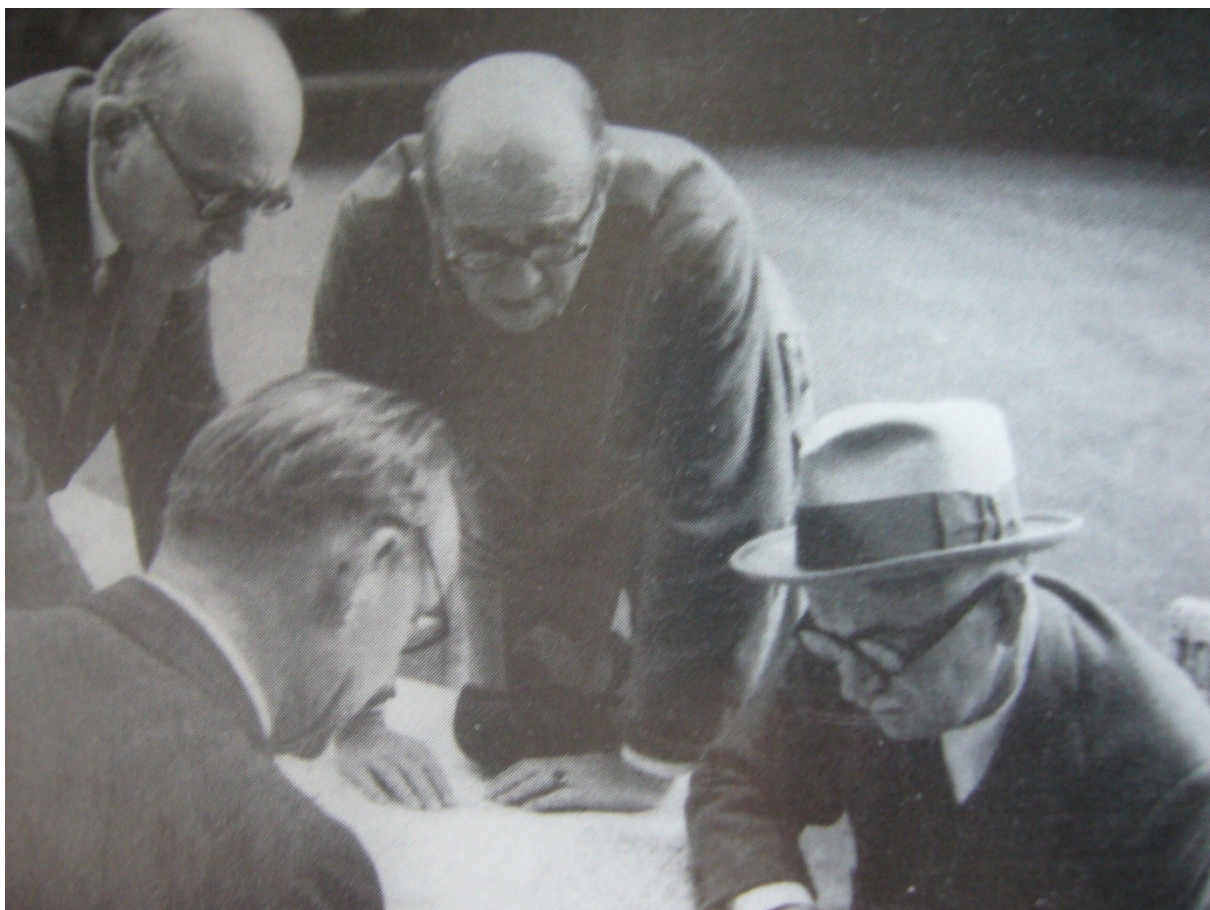
Edvard Beneš s ministrem zahraničí Janem Masarykem a se svými dvěma tajemníky v Anglii