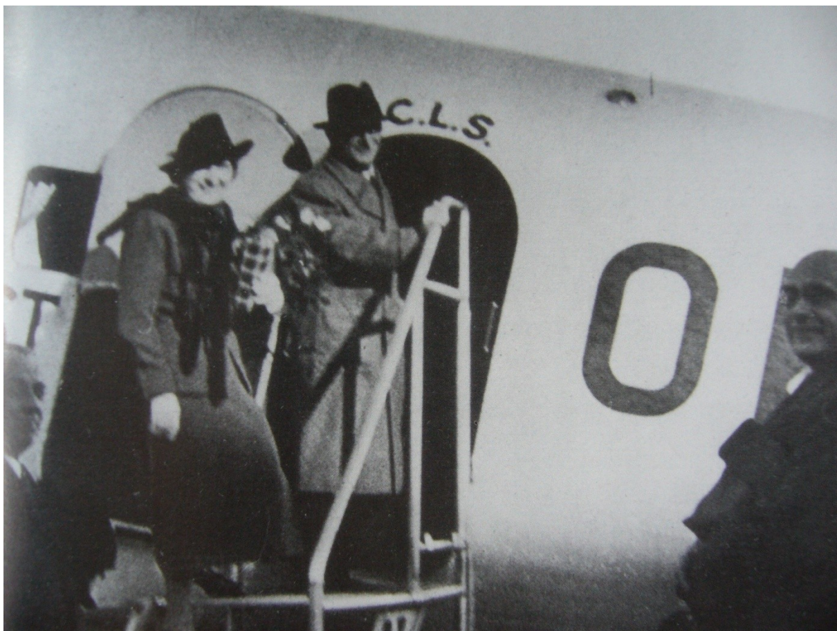
Edvard Beneš se svou ženou opouští nuceně Česko-Slovensko