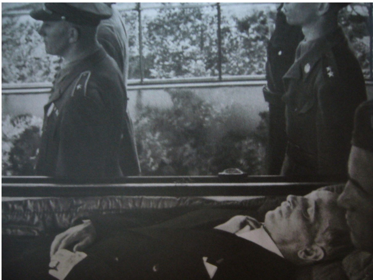
Pohřeb Edvarda Beneše