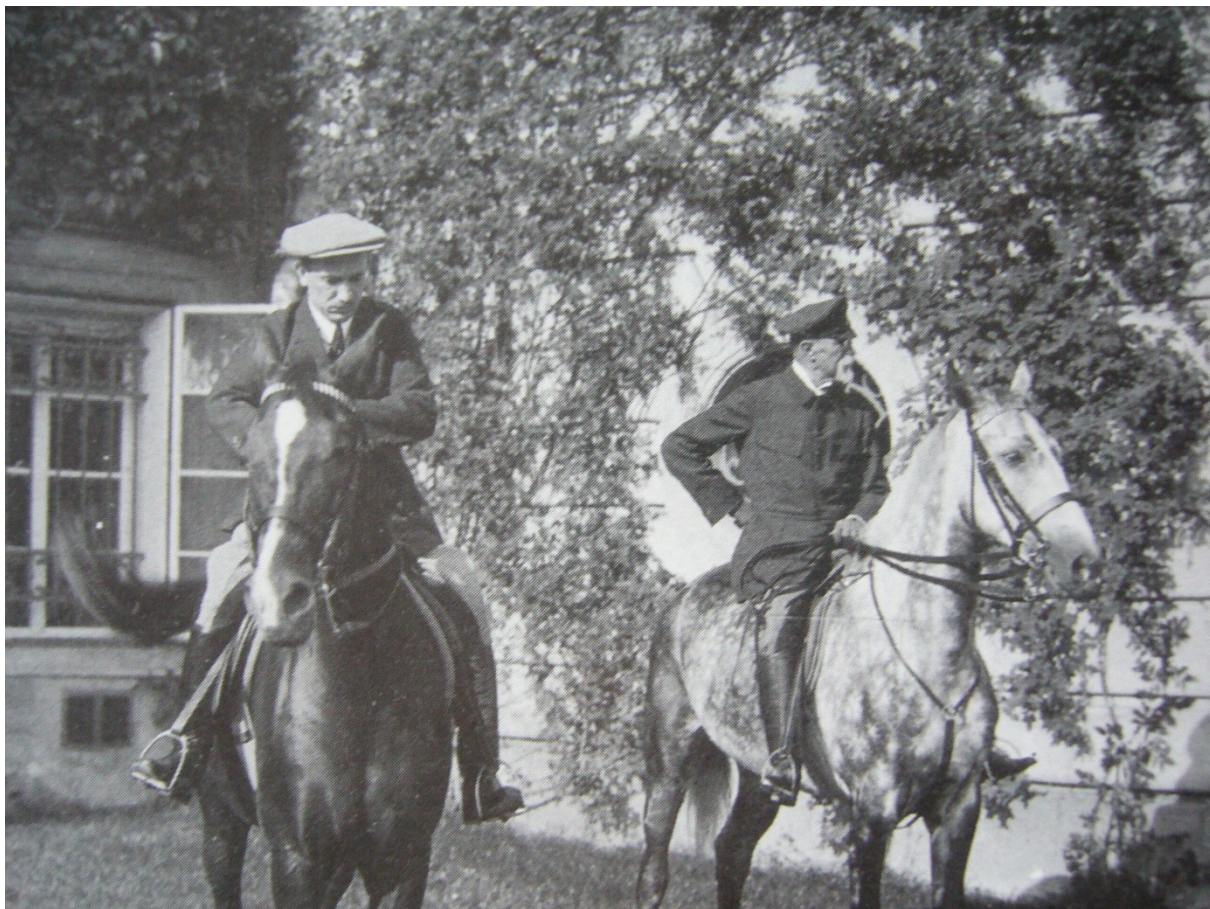
Edvard Beneš a Tomáš Garrigue Masaryk