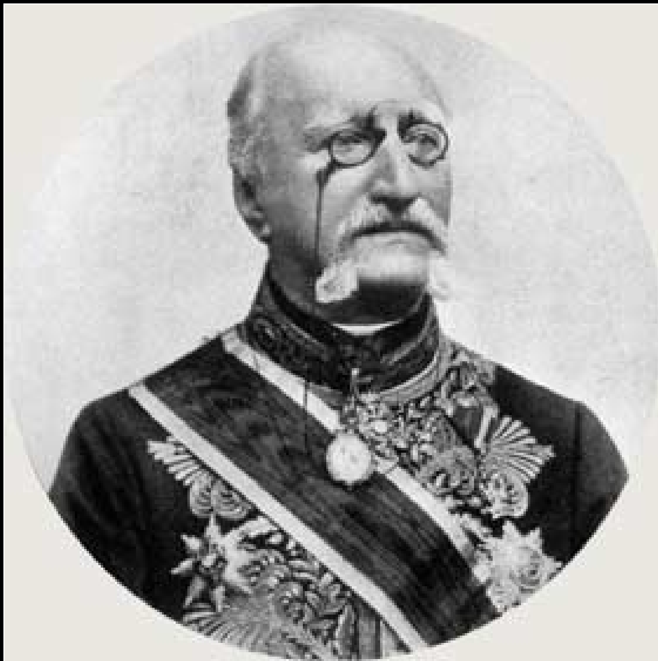
Rytíř Antonín Randa