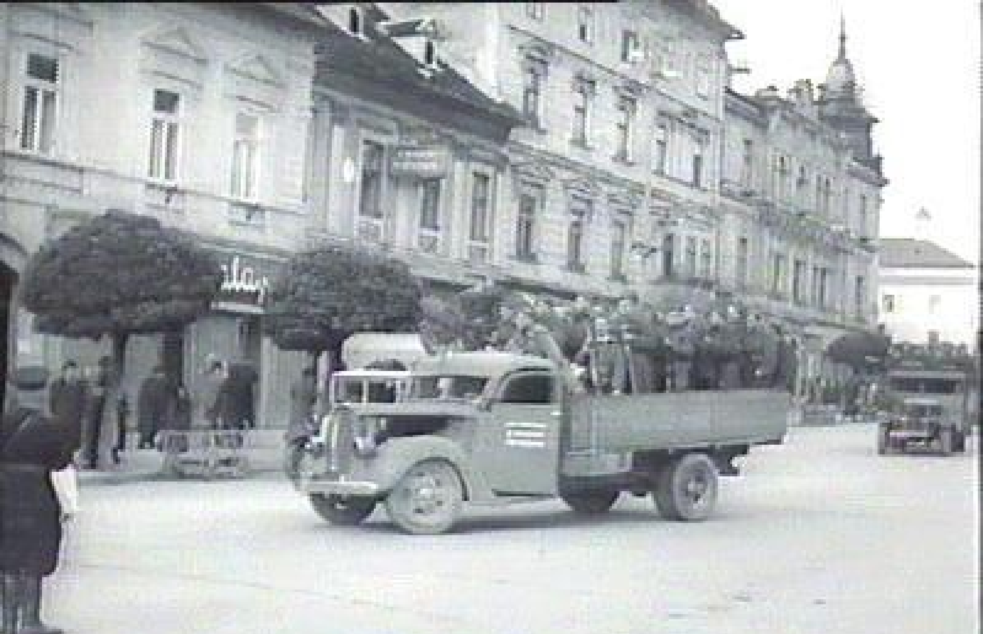
Banská Bystrica za SNP