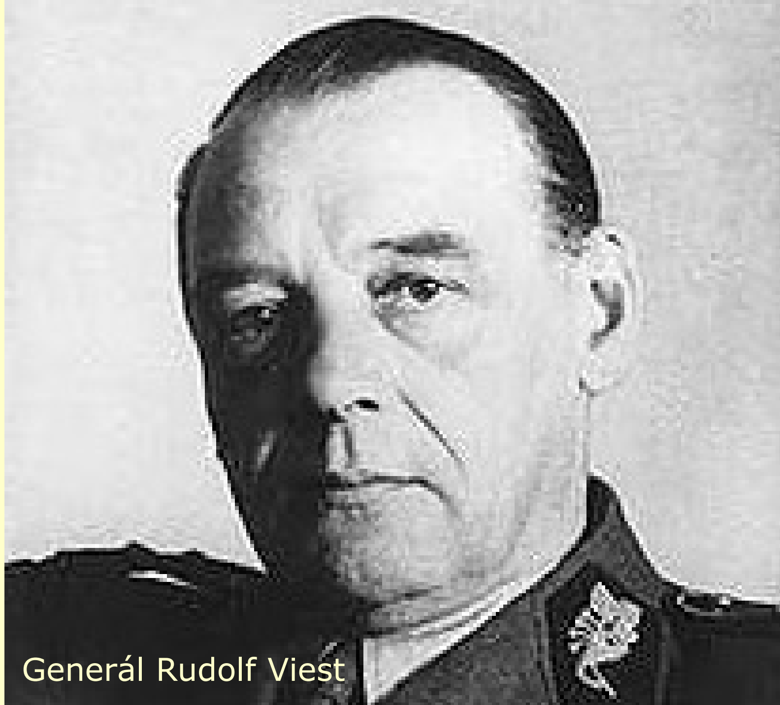
Generál Rudolf Viest