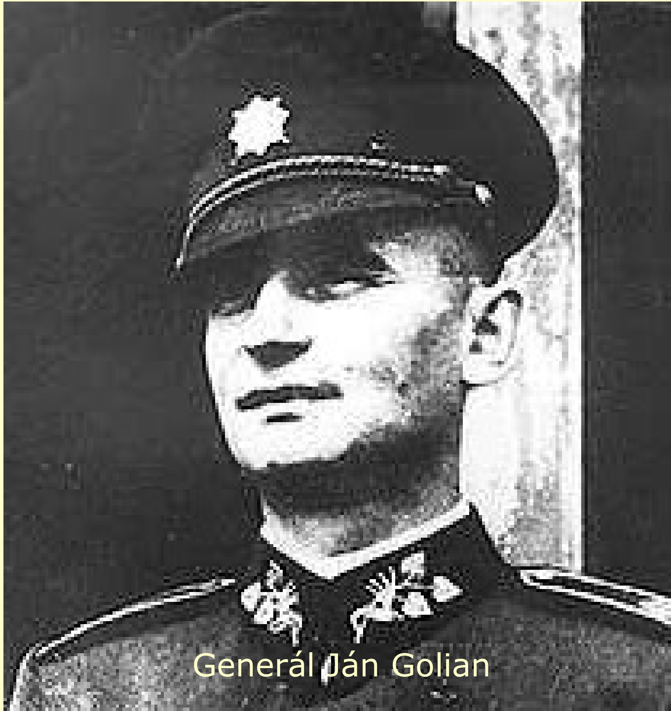
Generál Ján Golian